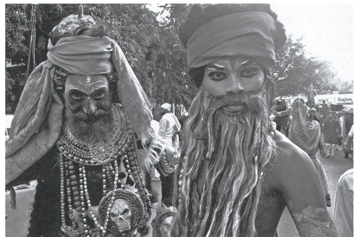
Strassenprozession zu Ehren von Sai Baba.

2016 wurde der Capitol Complex, der auch die Rückseite der alten Schweizer Zehnernote schmückte, in die Liste des Unesco-Weltkul-