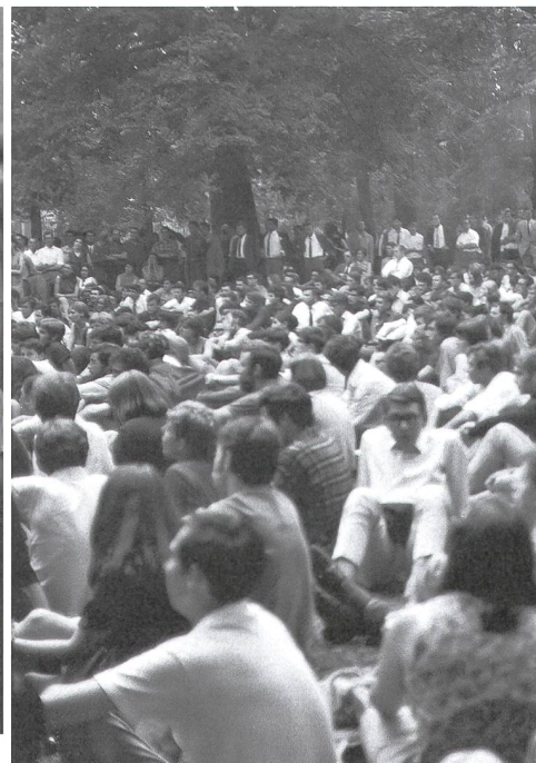
Basel, 28. Juni 1968, Petersplatz: Diskussion über die Ursachen der studentischen Revolte.

Jede Revolte hat ihre Vorläufer, sucht ihre Anlässe und findet ihren Kulminationspunkt. Auch wenn das Jahr 1968 für eine globale Bewegung steht, eine Welle, die fast überall hinreichte, hatte doch jedes Land seine eigenen Katalysatoren und Betablocker, die diese verstärkten und jenes abschwächten. Mässigend wirkten in der Schweiz die föderale Struktur, die Doppelidentitäten der Sprachregionen, die nicht manifeste faschistische Vergangenheit – aufputzend der Übereifer der Schweizer Militärs im Kalten Krieg und die exzessive Bewirtschaftung des Schweizerischen Bünzlitums durch die Obrigkeit, die an der Expo 1964 im Skandal um die «Gulliverumfrage» ihren Ausdruck fand.