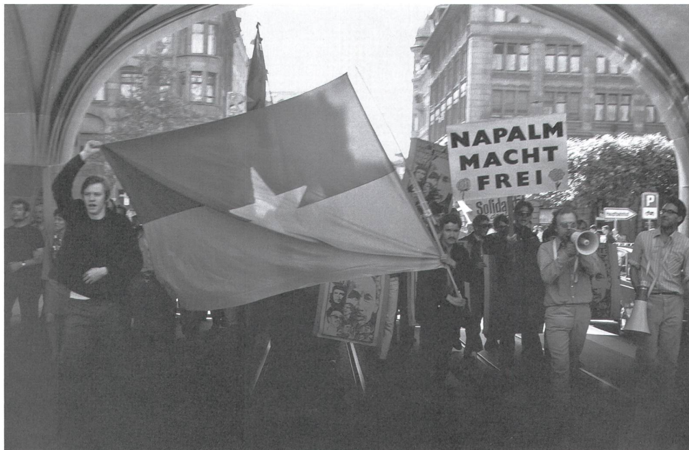
Zürich, 22. Juni 1968: Demonstration zum Schweizerischen Vietnamtag.

und die gesellschaftlichen Folgen der Revolte. 68 – was bleibt? ist ein Buch zum Weiterdenken. Text: Rolf Bossart