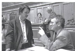
Paul Rechsteiner und Arnold Koller, 1989

1989 flog die staatliche Spitzelei, die weit um sich greifende Beschattung etlicher, meist unbescholtener Bürgerinnen und Bürger auf. Im Nachgang zur nebulösen Demission von Bundesrätin Elisabeth Kopp setzte das Bundesparlament – insbesondere auf Druck von den noch jungen Nationalräten Peter Bodenmann und Paul Rechsteiner – 1988 eine Parlamentarische Untersuchungskommission (PUK) ein. Die PUK – erst die zweite in der Schweiz nach der «Mirage-Affäre» 1964 – nahm die Tätigkeiten des von Kopp geführten Eidgenössischen Justiz- und Polizeidepartements unter die Lupe.