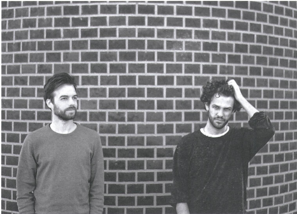
Too Mad

Too Mad veröffentlichen ihre zweite EP Mad Men Rise , eine Platte mit ordentlich Punch. Von Roman Hertler