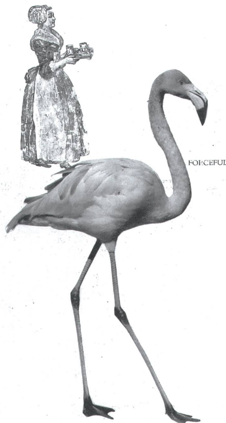
Collage von Marlies Pekarek

Natürlich ist diese Beschreibung eine ziemlich platte Untertreibung: Je nachdem, wie man schreibt, kann dieses Aufheben einen Gewaltakt bedeuten, einen Gewaltakt an sich selbst und an der Sprache. Und je nachdem, wie wir uns, als Leserinnen und Leser, gerade in diesem eigenen Haus umtun, wird uns das Aufraffen zur Begegnung mit dem Poetischen leichter oder schwerer fallen. Man muss die Türschwelle schon übertreten wollen – und die Reise ins Unge- wisse beginnen, die vielleicht macht, dass nachher Einiges nicht mehr so ist, wie es einmal war. Eine solche Ungewiss-