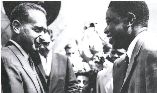
Dag Hammarskjöld und Patrice E. Lumumba 1960

«Morgen treffen wir uns, der Tod und ich.» Der Satz steht in einem Tagebucheintrag aus dem Jahr 1930 von Dag Hammarskjöld. Drei Jahrzehnte später, am 17. September 1961, kommt Hammarskjöld im Kongo ums Leben. Er ist unterwegs, um im Katanga-Konflikt zu vermitteln, als seine Uno-Sondermaschine abstürzt. Vollständig aufgeklärt ist das mutmassliche Attentat bis heute nicht.