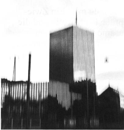
Nr. 303, September 2020

Der Titel ist ein Supertreffer. Und das Thema ebenfalls. Was für Rollstuhlfahrer gilt, das wird in Zukunft auch für die Mikromobilität ein Thema werden. Viele, ich auch, bevorzugen ihr Auto lieber vor der Stadt zu parken und sich innerhalb des Stadtraums fortzubewegen. Da spielen für uns, genau wie für die Rollstuhlfahrer, die BARRIEREFREIHEITEN der Trottoirübergänge eine enorme Rolle. Will heissen, sie behindern uns genau wie die Rollstuhlfahrer enorm. Der grosse gepflästerte und deshalb holprige Teil der Innenstadt ist zwar schön, schmälert aber die Option Mikromobilität stark. Rollstuhlbreite glatte Flächen durchgehend durch die ganze Stadt wären zukunftsfruchtig und würden St.Gallen zur Ehre gereichen.