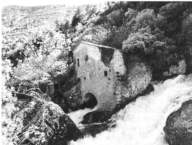
Auf «versunkenen Wegen» in den Cevennen, vom Moulin de la Foux bis zur Morgenstimmung im Tal der Vis.