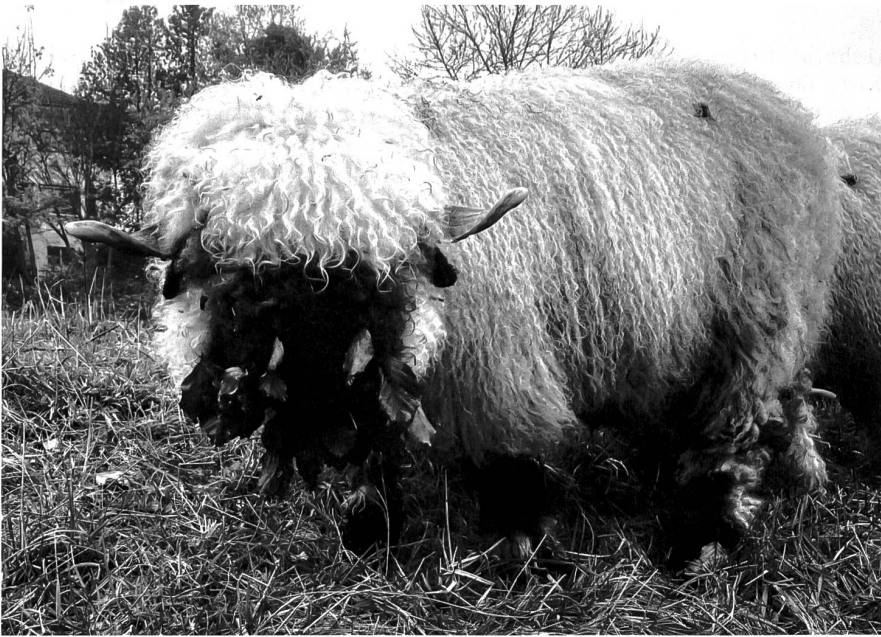
Geborenes Blackface: ein Walliser Schwarznasenschaf, fotografiert an der St.Jakobstrasse.

Wenn man schlechte Angewohnheiten loswerden will, zum Beispiel die schaumige Süssigkeit jeden Tag, hilft es, sich zu fragen, was schwerer wiegt: der Disziplinschmerz beim Verzicht oder der Schmerz des Bedauerns, wenn man Jahre später mit den Folgen seiner Laster konfrontiert ist, in diesem Fall vielleicht Übergewicht oder Diabetes.