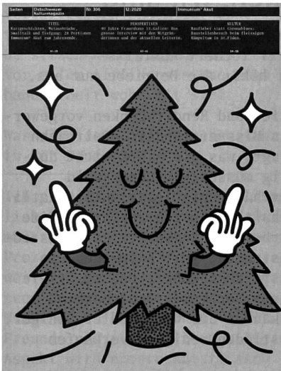
Nr. 306, Dezember 2020

Euer Magazin ist Monat für Monat eine wahre Schatzkiste, vollgepackt mit inspirierenden, bestärkenden, ermutigenden, ermächtigenden Schätzen. Aktuell und hochwillkommen das «Immunität» akut - gleichsam erheitend wie ernsthaft - so auch die andern Beiträge: ein wahrhaft horizont-erweiternder, grenz-überschreitender, hoffnungs-stiftender Lichtblick in unsrer Kultur/Gesellschaft/Politik-Medienlandschaft. Ganz herzlichen Dank für die Stärkung des Immunsystems «der andern Art»!