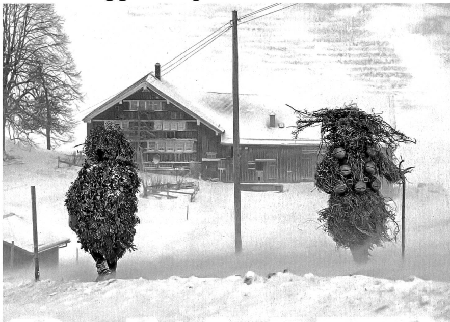
Wüeschte Chläuse unterwegs am Alten Silvester

Die sächsische Schweiz im Erzgebirge, im äussersten Osten Deutschlands, ist eine schöne Gegend. Aber tief-schwarz – was die Zahl der Corona-Infektionen betrifft. Mehr als 2300 Ansteckungen auf 100'000 Einwohnerinnen und Einwohner: Damit ist der Landkreis deutschlandweit traurige Spitze. Und ebenso hoch ist hier die Zahl der AfD-Wählerinnen und Wähler. 35,5 Prozent wählten 2017 bei der Bundestagswahl die Rechtsausen-«Alternative für Deutschland».