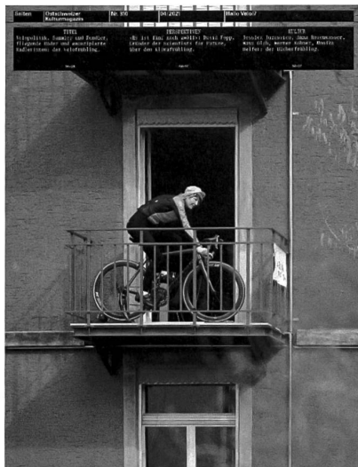
Nr. 310, April 2021