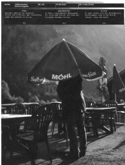
Nr. 313, Juli/August 2021

Zum Artikel saiten.ch/vier-guellener-graffiti