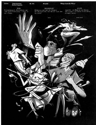
Nr. 314, September 2021

Hallo! Han grad s'Magazin glese und wöt mich bedanke für die tolle Biträg zude Pflegeinitiative! Durch so Biträg hani grossi Hoffnig, dass s'Volk im November richtig abstimme wird. Danke, danke, danke! Es isch dä schönst Bruef, au wenna amix härt isch!