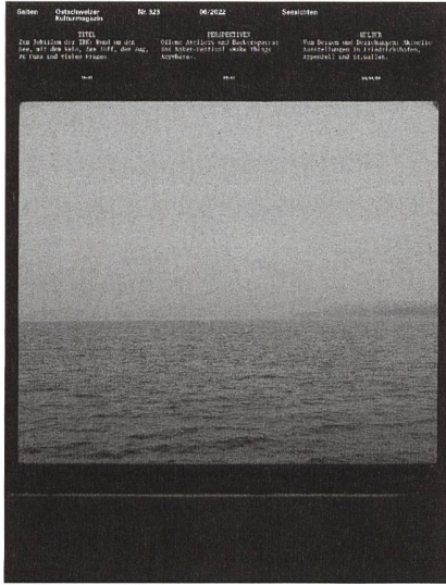
Nr. 323, Juni 2022

Was für ein tolles Konzert. Und ja: Die Ping-Pong-DJ-Abende sind unvergessen.