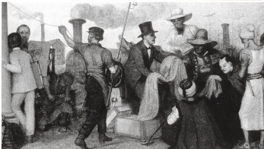
oben: Schwarze Familie auf einer Baumwollfarm, um 1890 unten: Gottlieb Emil Rittmeyer: Handel und Industrie in St.Gallen , 1881, Textilmuseum St.Gallen