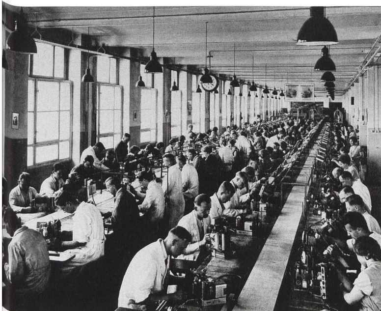
Montage von Rundfunkgeräten um 1930