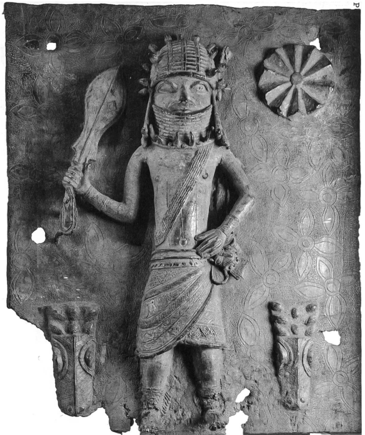
Die St.Galler Bronzen: Gedenkkopf für die Königinmutter Iyoba und Reliefplatte. (Bilder: online-collection.ch )

rezipiert wurde in der öffentlichen Debatte. Die Gruppe schrieb sinngemäss: «Wir wollen doch nicht, dass Objekte dorthin zurückgehen, wo die Könige regierten, die unsere Vorfahren versklavten und an die Europäer verkauften.»