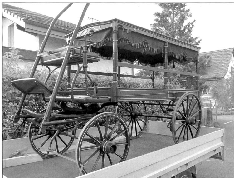
Leichenkutsche, versandfertig (Foto auf Ricardo, April 2023)

In der Stadt ist es Mode geworden, sich in Gemeinschaftsgräbern beerdigen zu lassen. Anonym auf einem Rasenstück. In den Dörfern sind die Leichenzüge verschwunden, seit man die Toten nicht mehr zu Hause aufbahrt. Kürzlich war eine alte Leichenkutsche ausgeschrieben. Zierlich und leicht, für nur 600 Franken.