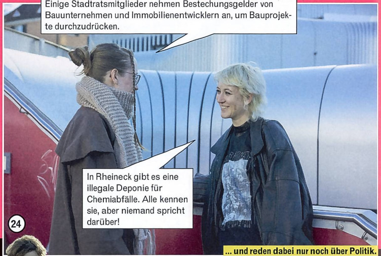
Angekommen beim Silberturm, flanieren die beiden durch die Mall ...

Einige Stadtratsmitglieder nehmen Bestechungsgelder von Bauunternehmen und Immobilienentwicklern an, um Bauprojekte durchzudrücken.