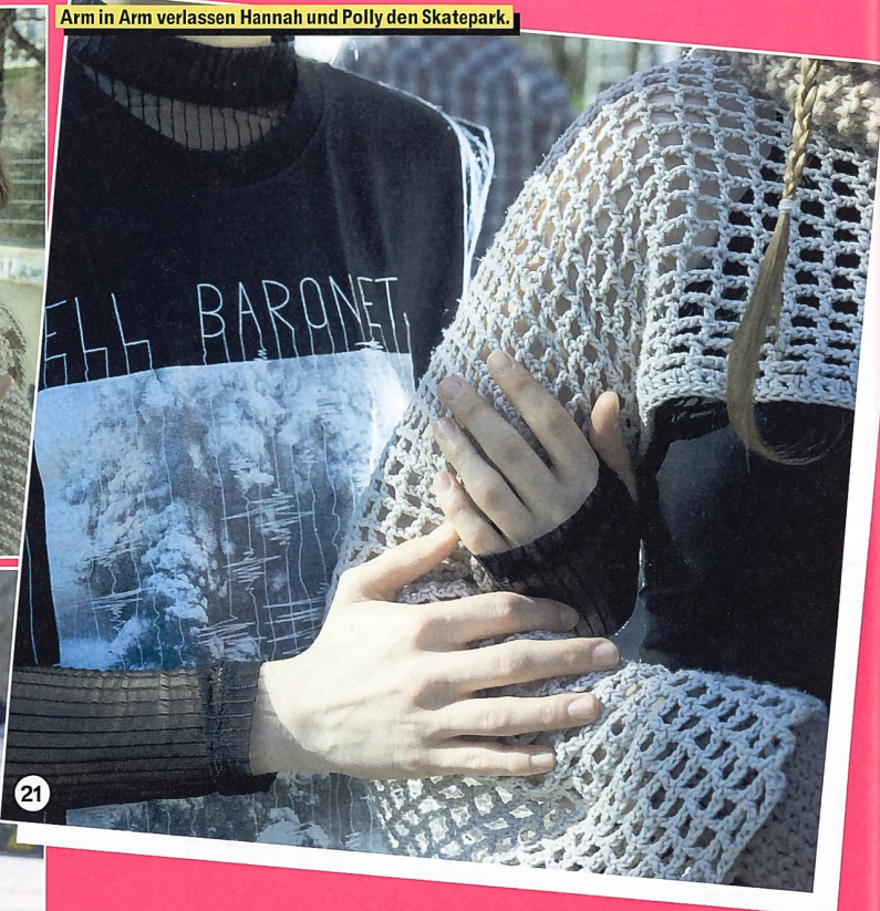
... lässt sich aber schliesslich auf Polly ein und versetzt Ron.