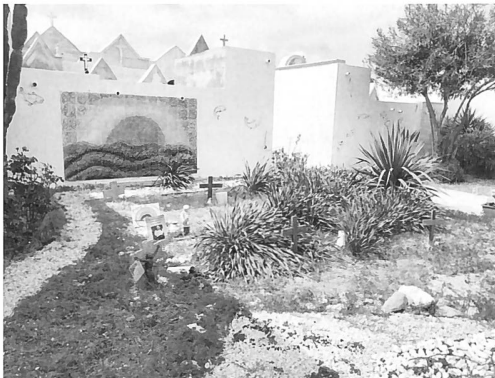
Auf dem lokalen Friedhof haben Bewohner:innen und kirchliche Gruppen eine Ruhestätte für gestorbene Migrant:innen eingerichtet. Manchmal sind ihre Namen nicht bekannt.

Einige Minuten später kommt der Leiter, gibt mir die Hand. Die Sonnenbrille behält er auf, während er mit mir spricht. Ob ich reinkönne, frage ich. Er verneint. Besuche seien nicht erlaubt, auch nicht von Journalist:innen oder Anwalt:innen. Ob er mir ein paar Fragen zum Hotspot beantworten könne, frage ich. Er sagt, es tue ihm leid, das ginge nicht. Dafür bräuchte ich eine Bewilligung von der Zentrale aus Rom. Ob die Leute denn rauskönnten, frage ich. Er sagt, natürlich, jederzeit. Ob ich also mit jemandem von drinnen hier draussen sprechen könne, frage ich. Jetzt gehe das grad nicht, sagt er, er könne mir da leider nicht weiterhelfen. Europa, 2024.