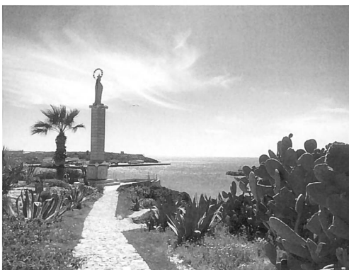
Die Heilige Barbara, Schutzpatronin der Bergleute und der Artillerie, wacht über dem Hafen und der Öffnung zum Meer.