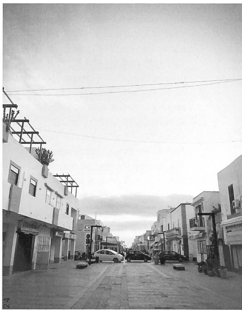
Die Fussgängerzone Via Roma. In der Nebensaison schlendern die Einheimischen hier oder singen in der Bar Karaoke. Im Sommer quetschen sich hier tausende Tourist:innen durch.

Ein paar Tage später, der erste Blick auf den Hafen ist schon ein wenig zur Routine geworden: Die Via Roma, die kleine Fussgängerzone, ist am frühen Morgen in eine entspannte Geschäftigkeit getaucht. In der Apotheke steht eine Handvoll älterer Leute an, es gibt hier Medikamente, Lippenstift und Gehstöcke zu kaufen. Gegenüber ist ein kleiner Carrefour-Supermarkt, davor steht ein Verkaufswagen mit frischen Früchten und Gemüse. Ich kaufe zwei Bananen und beschliesse, ins Inselinnere zu spazieren. Schliesslich esse ich seit drei Tagen hier jeden Morgen zum Frühstück ein unglaublich buttriges, unglaublich feiss gefülltes «Cornetto al Pistacchio». Und nein, normalerweise