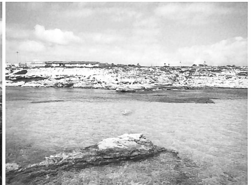
Zum Reinspringen: In den Buchten um Lampedusa leuchtet das Meer in verlockenden Blautönen.