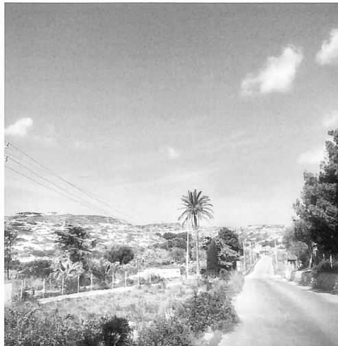
Die Strasse führt zum Hotspot. Hierher werden die angekommenen Menschen in Bussen gefahren. Nach einigen Tagen werden sie aufs Festland gebracht. Das Zentrum hat 450 Plätze – in den Sommermonaten gibt es mehr Überfahrten, dann ist es zu klein.