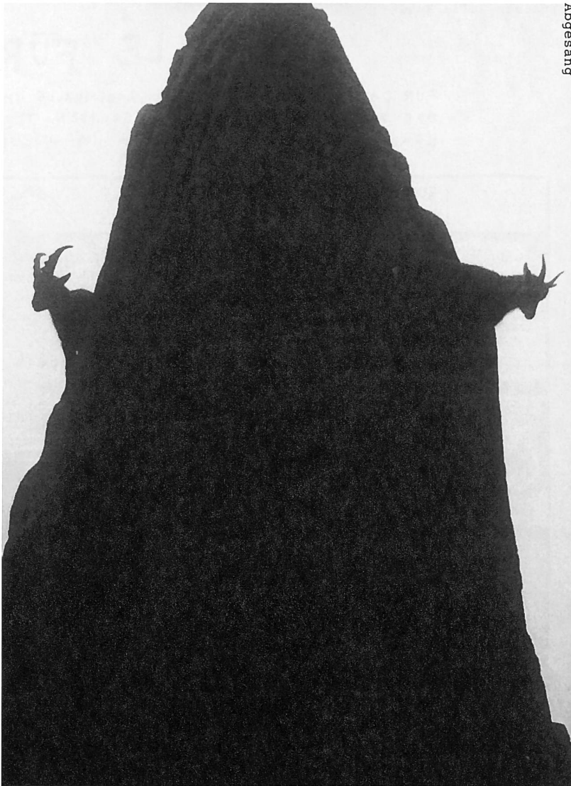
Peter und Paul im Nebel.

Ärzte sagen, das rechte Auge habe sich damals für immer abgeschaltet. Man hätte es daran hindern können. Doch an der OPOS verfolgten sie eine neue Methode, die sich erst später als falsch erwies. Und nun zu Vetter Johann, der mich auf Betreiben der Grossmutter eben doch besuchte: Er nahm mich mit in den Tierpark Peter und Paul.