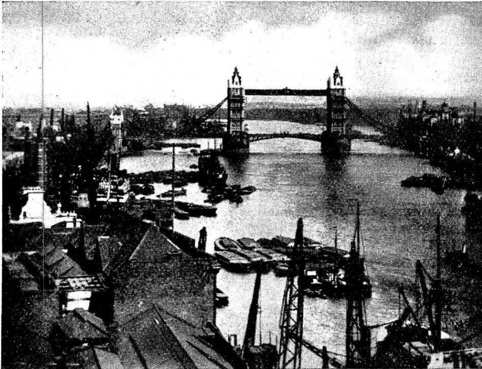
London, die Tower Brücke.

Zweck der Museen werden gefördert durch die kaum beschränkte Besuchsmöglichkeit (den ganzen Tag und sogar auch nachts teilweise offen). Besonders im Naturhistorischen Museum kann sich gerade der Tierarzt in dem fabelhaften Reichtum der Sammlungen ganz vergessen, auch ohne die Schaustücke wirklich fabelhafter Grösse, wie Meteoriten von 683 kg oder gar 3\frac{1}{2} t, oder des allerdings nur nachgebildeten Dinosauriers von Wyoming U. S. A. 1905, des Herrn (oder Frau) Diplodocus Carnegii von 12 Fuss 9 Zoll Höhe und 84 Fuss 9 Zoll Länge hervorzuheben.