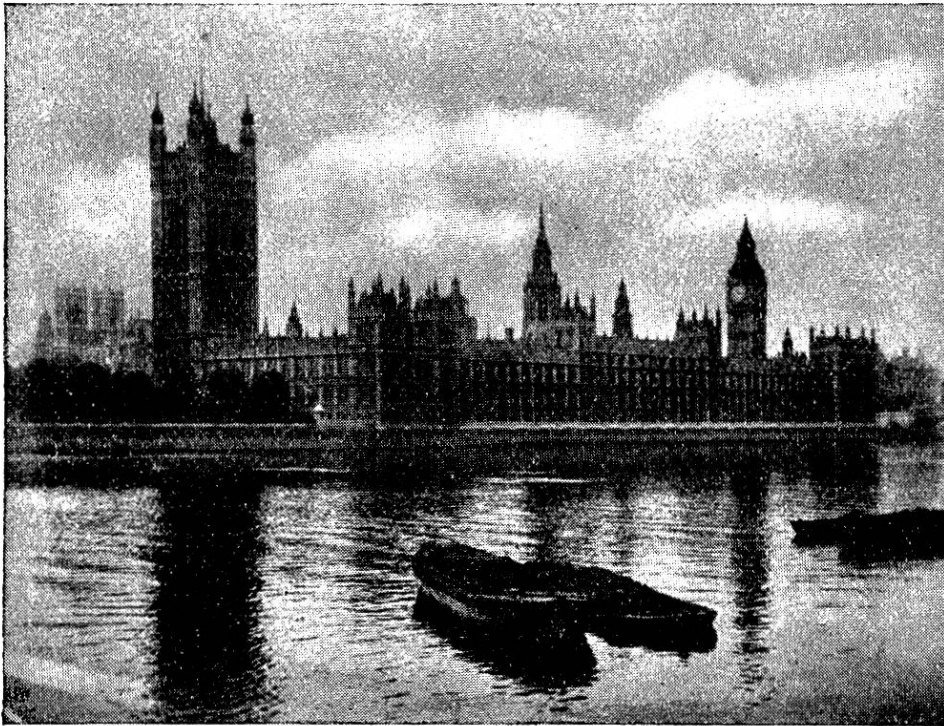
London, das Parlamentsgebäude von der Themse.

des Zuges das voll froher Erwartungen lebhaft geführte Geplauder verstummen. Trotz gelöschter Lichter ist es kein Schlafen, sondern bloss ein Schlummer und trotzdem müssen wir geduldig warten, bis der erwachende Tag uns Einblick in die durchfahrene Gegend gewährt. Dieselbe hat aber eintöniges Gepräge: von Laubholz umsäumte Weiden mit meist rotbraunem oder geströmtem, seltener schwarzfleckigem Vieh und einigen Pferden, meist Schimmel oder deren Variationen, dazwischen langgestreckte Getreidefelder, soweit das Auge schaut.