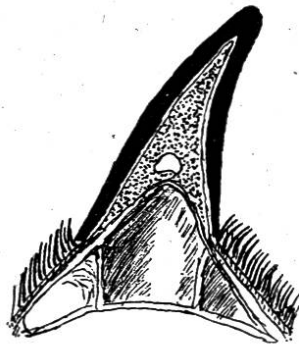
1. Schemat. Skizze des Mitteltyps bei den Gemskitzen aus dem Ofenberggebiet des Schweiz. Nationalparkes. Über der Stirnbeinapophyse ist mit 7 Monaten nur ein ca. 2,5 mm breites und dickes Os cornu vorhanden.

Was aber das Auftreten eines echten Os cornu bei der Gemse angeht, bin ich seit 8 Jahren in den Besitz von 7 Gemskitzkadavern aus dem Schweizerischen Nationalpark gelangt, und konnte ich hier in allen Fällen ein einwandfreies Os cornu feststellen, das sich erst mit 5 Monaten bei einer Länge der Hornscheiden von ca. 3 cm zu bilden beginnt, und zwar hier umgekehrt wie beim Rinde, erst nach der Aufwölbung der Frontalapophyse und der Sinusbildung (Abb. 1). So wertvoll für unser Problem diese Feststellungen sind, muß ich doch sagen, daß in einem Gebiete des Parkes, woher alle diese Kitzen stammen, ständig Pica herrscht und selbst bei Hirschen fast papierdünne Schädelknochen angetroffen wurden, somit also die Osteogenese dort