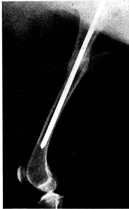
Abb. 1. Whippet. Femurfraktur lks. aufgenommen nach 74 Tagen. Der Hund trägt den Nagel jetzt seit 1½ Jahren ohne Beschwerden.

des distalen Bruchstückes divergieren zu lassen. Wir haben ebenfalls ähnliche Versuche mit mehreren Nägeln angestellt, konnten damit die Rotation aber nicht vollständig beheben, offenbar deshalb, weil wir die Nägel von einem Punkt aus einführten.