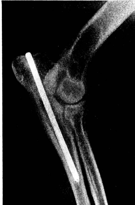
Abb. 2. Deutscher Schäfer. Olecranonfraktur lks. nach 80 Tagen aufgenommen und Nagel entfernt. Praktisch ohne Kallus geheilt.

Die Doppelfraktur von Radius und Ulna bietet bei der Reposition erhebliche Schwierigkeiten, weil die relativ kleinen Bruchflächen immer wieder abrutschen und unter dem Muskelzug aneinander vorbeigleiten, was sehr oft noch unter dem Fixationsverband geschieht. Es wurde deshalb