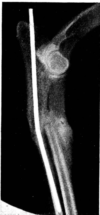
Abb. 3. Irish Setter. Fraktur von Radius und Ulna rechts. Nagelung der Ulna allein. Leichte Knickung nach hinten, da ein zu schwacher Nagel gewählt wurde. Aufnahme nach 60 Tagen und Nagel entfernt. Funktionelle Heilung gut.

poniert sein, weil sich bei nachträglichem Reponieren die Haut so stark spannen kann, daß die Reposition unmöglich wird. Sehr gute Resultate erhält man bei Tibiafrakturen, die nach dieser Methode fixiert werden (vgl. Abb. 4 und 5).