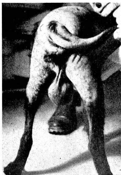
Abb. 7 Alopezie bei einem 14jährigen Terrierbastard mit Hodenkarzinom

Alopezie bei einem 6jährigen Zwergschnauzer-Hermaphrodit mit männlichem Habitus (atrophischer Penis) und Operationspräparat: Pyometra-Uterus, atrophische Ovarien, Hodenneoplasma rechts