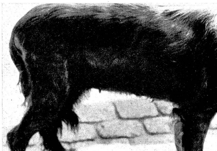
Abb. 10 Alopezie unbekannter Ursache. Dünnes Haarkleid, diffuse, feine trockene Schuppung, unscharf begrenzte Alopezieherde an beiden Flanken und Sitzbeinhöckern. Irish Setter, 10jährig, weiblich, Kachexie, chron. Nephritis und Myokarditis

Neben den bisher erwähnten, ätiologisch einigermaßen faßbaren Alopezien bleibt noch die Gruppe der Alopezien mit unbekannter Ursache zu erwähnen. Das Aussehen der Alopezie ist verschiedengestaltig, zum Teil symmetrisch, scharf begrenzt, bilateral oder unilateral, zum Teil aber auch unscharf begrenzte (Abb. 10) einzelne oder mehrere Alopeziebezirke. Differentialdiagnostisch ist in diesen letzteren Fällen immer auch an Demodikosis zu denken.