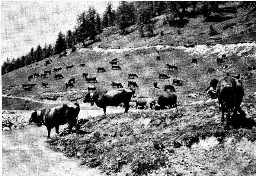
Là-haut sur la montagne

Tout cela démontre l'importance d'une autopsie. Aussi le vétérinaire cantonal porte-t-il à maintes reprises l'accent sur l'obligation pour chaque praticien d'apporter à l'exécution de cette opération un soin tout particulier.