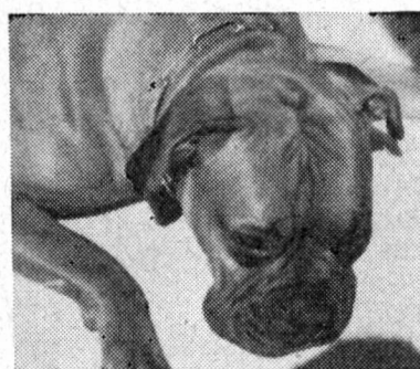
Fig. 1 Fig. 2

Leur aspect est celui d'une cicatrice allongée, dépourvue de poils, mais pigmentée normalement, ou celui de « tumeurs » globuleuses plus ou moins bosselées, dont la hauteur atteint plusieurs centimètres. Dans les formes bien développées, on constate de la fluctuation. Ces kystes peuvent, au cours des années, augmenter de volume ou se résorber d'eux-mêmes.