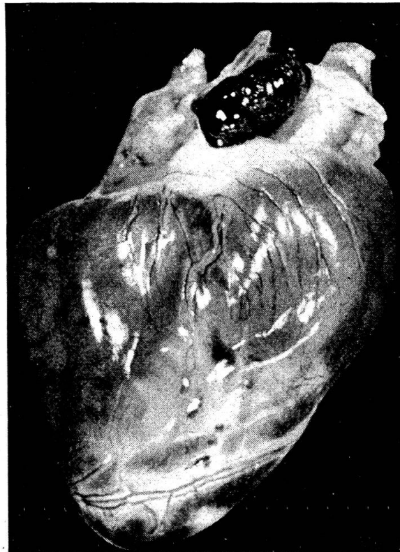
Abb. 1 Anaplastisches Hämangioendotheliom Pud. Nr. 6631. Die Veränderungen sind auf das rechte Herzohr beschränkt. Die Sickerblutungen aus der Geschwulst haben zu einem massiven Hämoperikard geführt.

Lediglich bei zwei von insgesamt 51 Herzbasistumoren wurde ein langsam entstehendes Hämoperikard beobachtet. In je einem Fall lag eine Melanommetastase im rechten Vorhof und eine karzinomatöse Tochtergeschwulst im linken Vorhof vor, die zu Sickerblutungen Anlaß gegeben haben.