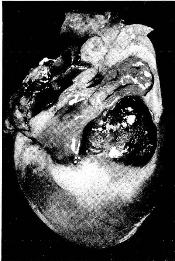
Abb. 2 Hämangioendotheliom an der Basis des rechten Herzvorhofs eines 14jährigen Pudelrüden. Sickerblutungen.

Diese Gefäßgeschwülste des Herzens zeigen histologisch eine auffallend stark variierende Gewebsdifferenzierung, neben kavernen Angiomen treten besonders stark anaplastische (maligne) Hämangioendotheliome auf. Histopathologische Einzelheiten bei solchen Gefäßgeschwülsten und Endokardrissen werden später veröffentlicht.