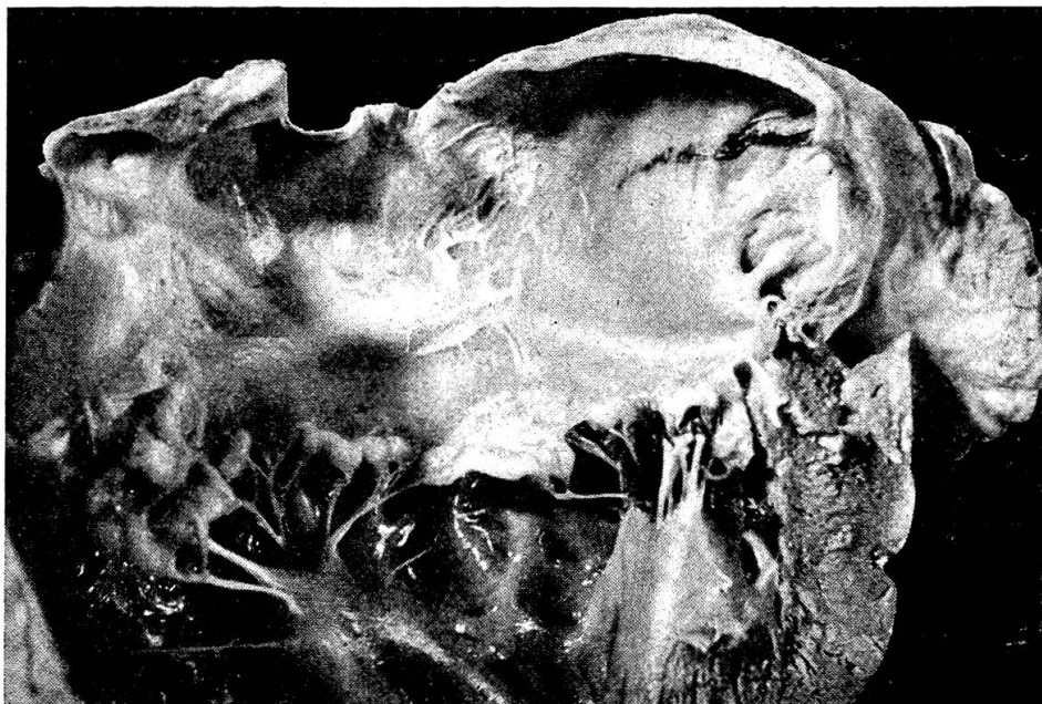
Abb. 4 Sogenannter Endokardriß im linken Vorhof, der zu einem massiven Hämoperikard mit Herztamponade geführt hat. Die knotige Fibrose der Mitralklappe ist sehr deutlich erkennbar (Älterer Pudelrüde).