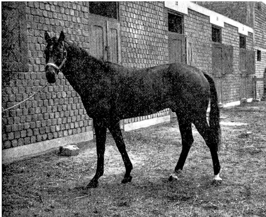
Abb. 2 AIE-positiver Vollblüter vor einer Stallabteilung des Rennplatzes Monterrico in Lima, Peru.

Toma und Goret [27] haben in diesem Jahr auf Grund ihrer Feststellungen bei Traberpferden mit Hilfe der Immunodiffusions-Präzipitation und eventuellen klinischen Verdachtsmomenten Untersuchungen über die Verbreitung der AIE bei Traberpferden in Frankreich durchgeführt. Diese ergaben, dass die AIE in diesem Milieu als eine «maladie honteuse» betrachtet wird, indem es nicht oder kaum möglich ist, Auskünfte zu erhalten oder weil Pferde in einem Krankheitsherd umgestellt werden. In einer aufschlussreichen Tabelle werden die erzielten Ergebnisse zusammengefasst (siehe Tabelle nebenan).