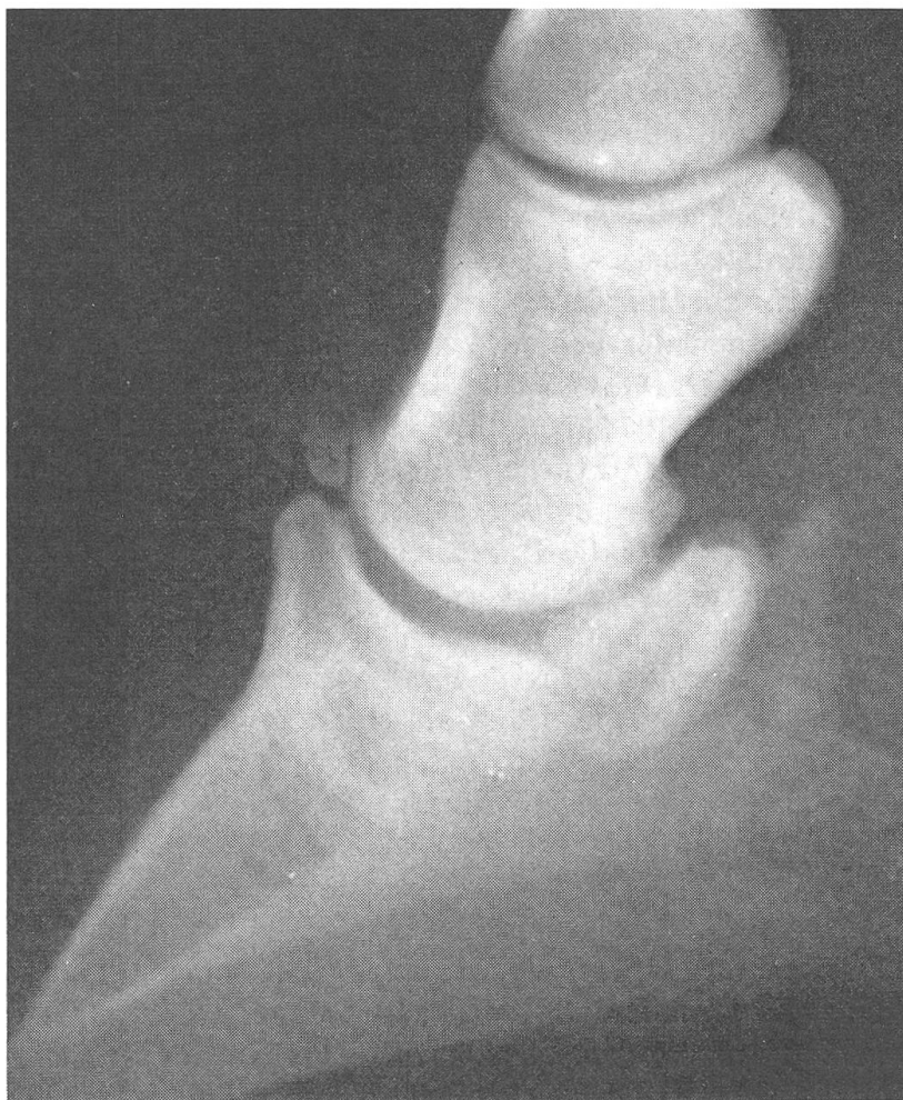
Abb. 2 Seitliche Röntgenaufnahme des Hufes von Fall 2. Das abgebrochene Frakturstück ist ca. bohngross, am Kronbein besteht eine deutliche Periostreaktion.

seit einiger Zeit stark lahm, Wechsel zwischen vorn links und rechts. In der Klinik nur unregelmässiger Gang vorn rechts , nach Longieren nicht mehr, nach Reiten leichtgradige Trablähmheit vorn links , Wendeschmerz, nach tiefer Fesselanästhesie v.l.: Umspringen. Röntgen: Fraktur am Streckfortsatz beidseitig, links grösseres Stück, geringe Veränderungen am Strahlbein beidseitig. Wegen