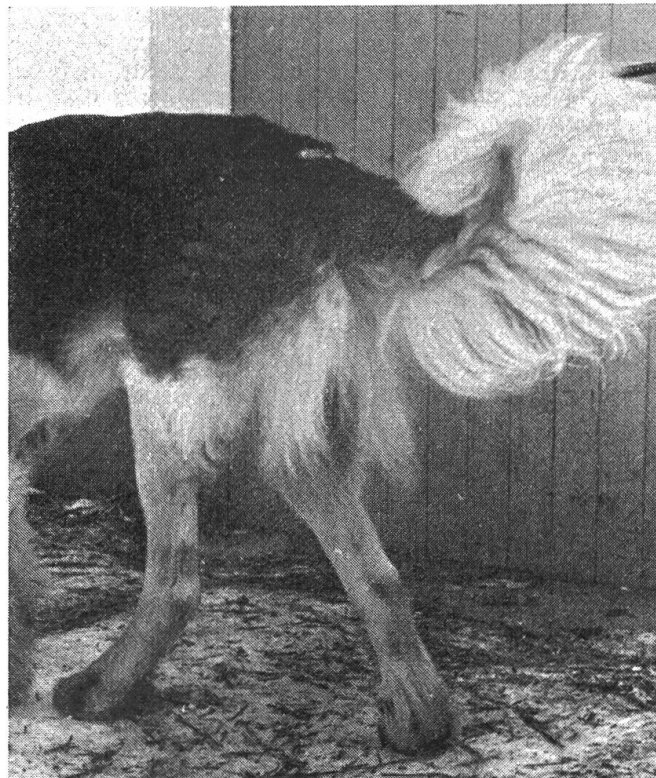
Fig. 5 Présentation de l'arrière-main dix jours après la seconde intervention.