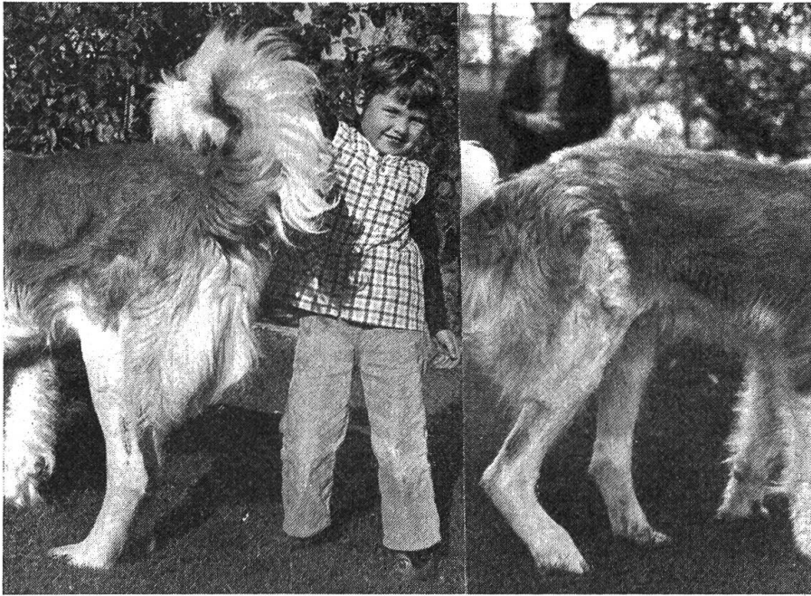
Fig. 3 Jarret gauche opéré; ceci avant l'intervention de droite.