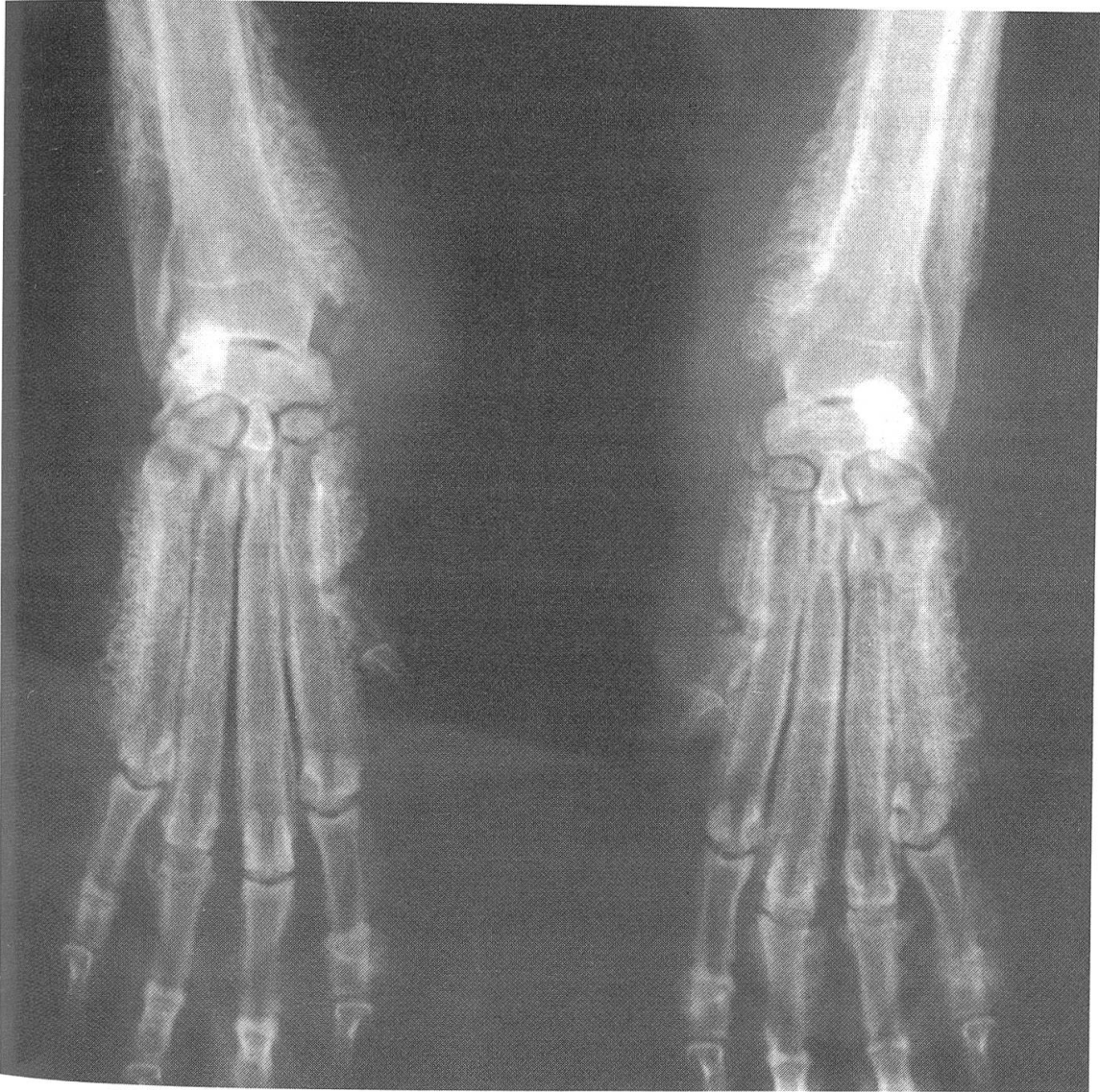
Fig. 3 Radiographie (a/p) du même site, du 2 avril 1985