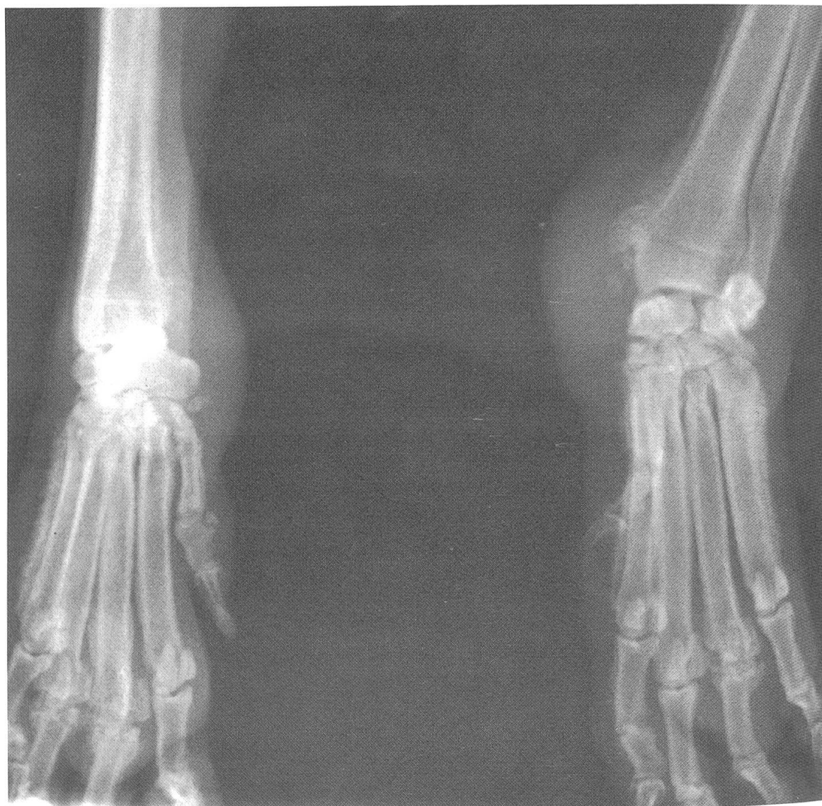
Fig. 2 Radiographie (a/p) des deux poignets, du 8 décembre 1984