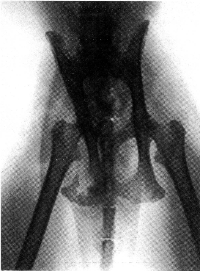
Fig. 1: Vue ventro-dorsale du bassin. Diminution du diamètre transversal, rotation du coxal droit autour de son axe, coprostase au niveau du canal pelvien.

0,7 cm. Le greffon est conservé dans un tube stérile, au congélateur, à -20^{\circ}\text{C} (Brinker et al., 1983; Bojrab, 1981), pendant les 7 jours séparant la récolte de la pose. Le greffon est dégelé à la température ambiante, trois heures avant l'implantation.