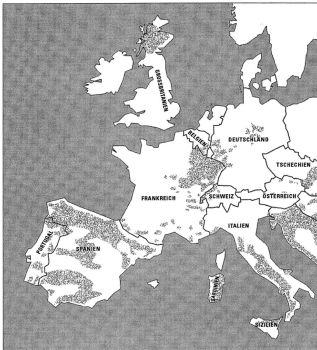
Abbildung 2: Verbreitung der Europäischen Wildkatze. Die Gebiete, in denen die Europäische Wildkatze heute vorkommt, sind mit Grauton angegeben.

Die Europäische Wildkatze ist unserer Hauskatze sehr ähnlich; ihre Körperlänge beträgt 50–80 cm, sie wiegt zwischen 3 und 6 kg. Früher war die Wildkatze weit verbreitet und besiedelte weite Gebiete von Westeuropa bis nach Indien. Wildkatzen leben als typische Einzelgänger und bevorzugen offene Wälder, Savannen und Steppen. Durch die drastische Einschränkung der Lebensräume ist die Europäische Wildkatze stark gefährdet. Sie kommt heute noch vor im französischen Zentralmassiv,