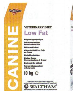
10 kg Low Fat CANINE LOW FAT