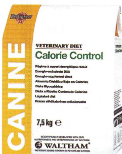
7,5 kg Calorie Control CANINE CALORIE CONTROL

VETERINARIA VAG 8021 Zürich, Grubenstrasse 40, Telefon 01 - 455 31 11