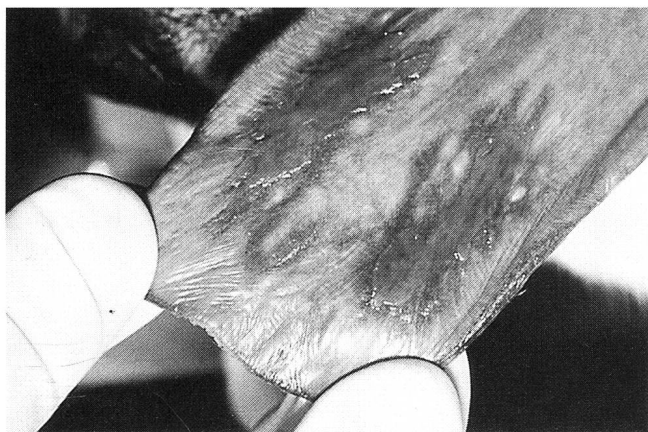
Abbildung 3: Längsovale symmetrische Ulzerationen an der Zungenunterseite

Die Zungenveränderungen der beiden Hündinnen präsentierten sich sehr ähnlich. Abgesehen von einem schmalen, makroskopisch unveränderten Längsstreifen in der Medianen war die vordere Hälfte der Zunge an der Oberfläche dunkelrot verfärbt, auffallend glatt und runzelig; die Papillen fehlten (Abb. 2). An der Zungenunterseite waren symmetrische, längsovale Ulzerationen vorhanden (Abb. 3). Ansonsten waren in der Maulhöhle keine Veränderungen sichtbar. Ösophagus und Trachea erschienen bei der endoskopischen Untersuchung unverändert. Mittels Skalpell wurde bei beiden Hunden von der Zungenober- und Unterseite im Randbereich der Läsionen je eine Biopsie entnommen und für die histopathologische Untersuchung in Formalin fixiert. Aus-