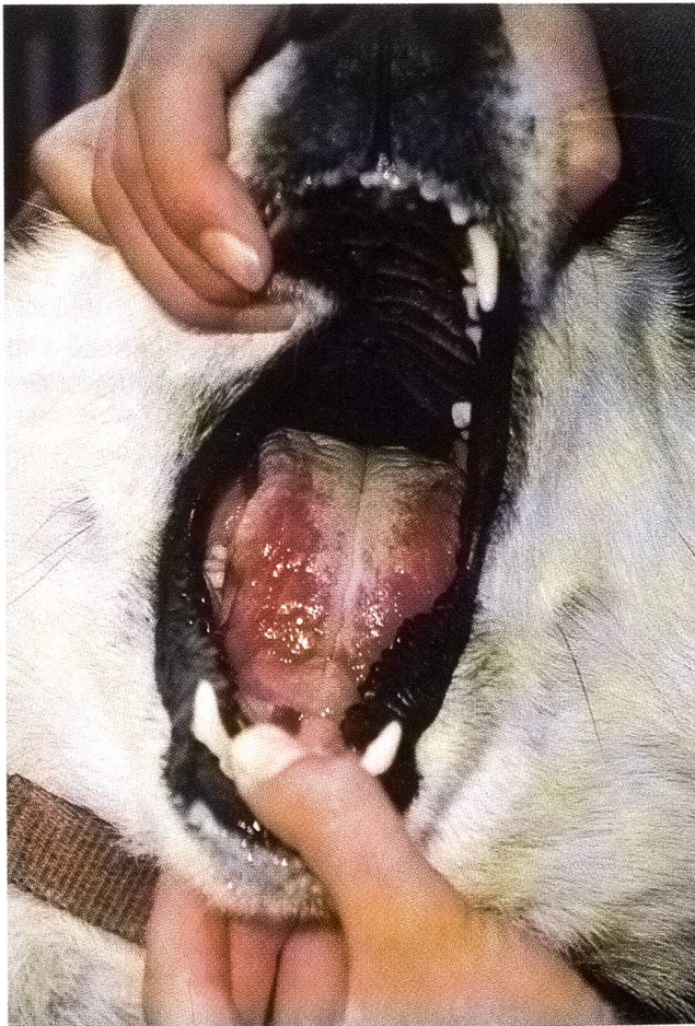
Abbildung 1: Akute Zungenulzerationen nach Sonneneinstrahlung

Eine Grönlandhündin, 3 Jahre alt, Körpergewicht 24 kg (Hund Nr. 1) und eine zweite Hündin derselben Rasse, 4 Jahre alt, Körpergewicht 19 kg (Hund Nr. 2) gelangten zur Abklärung. Abgesehen von der Maulhöhle, die wegen starker Abwehrbewegungen im Wachzustand nicht beurteilt werden konnte, ergab die klinische Untersuchung bei beiden Hündinnen keine abnormen Befunde. Auch sämtliche Parameter des Blutstatus und des blutchemischen Profils waren im Normalbereich.