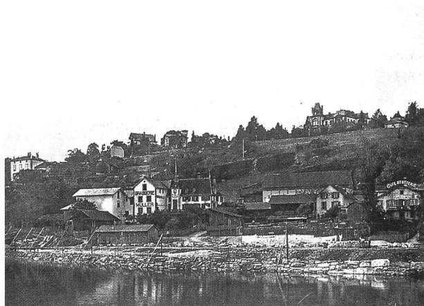
Abbildung 2: Brasserie Müller in Neuchâtel; rechts im Bild die von Gottlieb Brugger gepachtete Stallung (Seitenansicht, z. T. verdeckt).

Allerdings warf die Praxis nicht so viel ab, dass er bereits Geld an seine Eltern schicken konnte. Vielmehr besserte er sein Einkommen mit dem Viehhandel auf. Dazu pachtete er die Stallungen einer grossen Bierbrauerei (Abb. 2) für 2500 Franken im Jahr und war, um Heu- und Strohvorräte aber auch Kühe ankaufen zu können, gezwungen, einen Kredit von 10000 Franken bei einer Bank aufzunehmen. Diese Stallungen boten für 50 Kühe, 20–25 Schweine und 6–7 Pferde Platz. «Mit den Stallungen ist auch ein Logis vorhanden. Ich habe fest im Sinne, alsdann die Base Susanna anzufragen, ob sie die Haushaltung übernehmen wolle, denn es sind etwa 8 Knechte notwendig; ich selbst bezahle ja gegenwärtig 1000 Franken per Jahr für die Kost. Es käme mich die Sache dann auch bedeutend billiger...» (Brief vom 10. März 1883.)