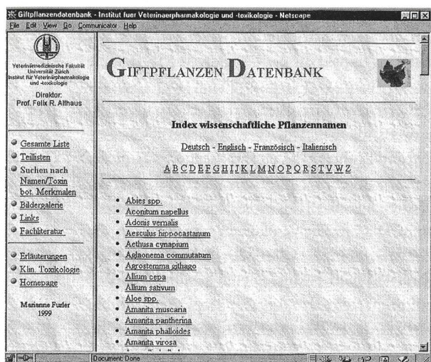
Abbildung 2: Das Hauptverzeichnis aller beschriebenen Pflanzen.

Internet-basierten Datenbanken, die sich ebenfalls mit Giftpflanzen befassen.