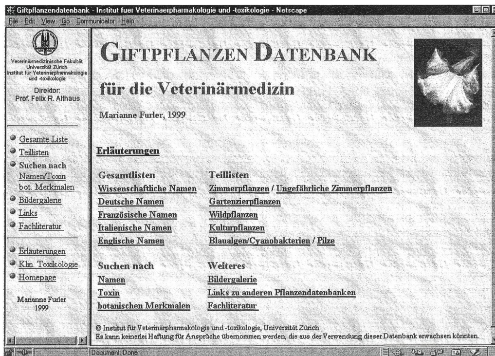
Abbildung 1: Einstiegsseite der Giftpflanzen-Datenbank.

Das hier vorgestellte Informationssystem über Giftpflanzen ist via Internet ( http://www.vet-pharm.unizh.ch ) oder Compact Disc abrufbar. Als Betriebssystem eignet sich sowohl Macintosh wie auch Windows oder UNIX, wobei eine HTML 3-fähige Version von Netscape Navigator oder Internet Explorer benötigt wird. Für den Einsatz mittels Compact Disc muss zusätzlich die JAVA-Option vorhanden sein. Der Anwender hat verschiedene Möglichkeiten, die elektronische Datenbank nach Informationen abzusuchen. Beim Einstieg wird daher als erstes eine Auswahl der Zugänge gezeigt, die zum schnellen Auffinden der gewünschten Angaben benutzbar sind. Insbesondere stehen verschiedene Inhaltsverzeichnisse und zwei Suchfunktionen zur Verfügung (Abb. 1). Auf der Einstiegsseite kann auch eine Bildergalerie angewählt werden, die alle Pflanzen der Datenbank zeigt und somit einen raschen Überblick ermöglicht. Ferner bietet die Einstiegsseite direkte Verbindungen zu anderen