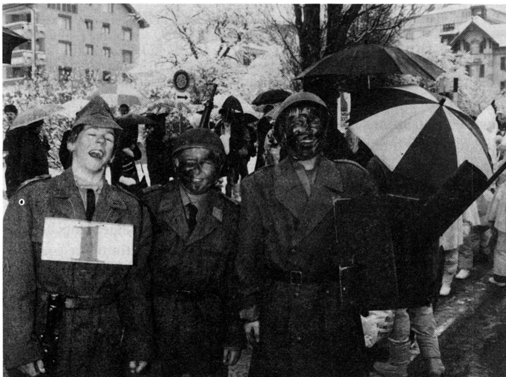
Fig. 1. Une parodie allègre. L'armée suisse au cortège des enfants à Glis, le 11 février 1988.

sociétés locales de la fonction essentielle qu'ils remplissaient dans les fêtes. Le carnaval en particulier, dont ils étaient les principaux acteurs, échappa dès lors à leur ardeur, pris en charge par des groupes spécialisés dont les membres, tous adultes, se promurent agents de la satire publique 4 . Ce furent les enfants qui devinrent les rois de la fête, tirant parti de la mythification nostalgique dont l'enfance, assimilée au Paradis perdu, était l'objet de la part des adultes de l'âge industriel. Or l'observation du carnaval en Suisse révèle que si les enfants continuent à y occuper le devant de la scène, les adolescents manifestent leur présence avec une vigueur qui semble croître d'année en année. Quel rôle jouent-ils dans cette fête organisée par les adultes des sociétés carnavalesques? C'est une réponse à cette question que j'aimerais proposer ici à partir des données que j'ai recueillies dans le Haut-Valais entre 1976 et 1982. Mais il me faut d'abord préciser mon approche du carnaval.