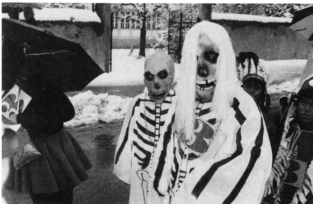
Fig. 5. La mort grotesque, exorcisée par le rire. Cortège des enfants à Glis, le 11 février 1988.