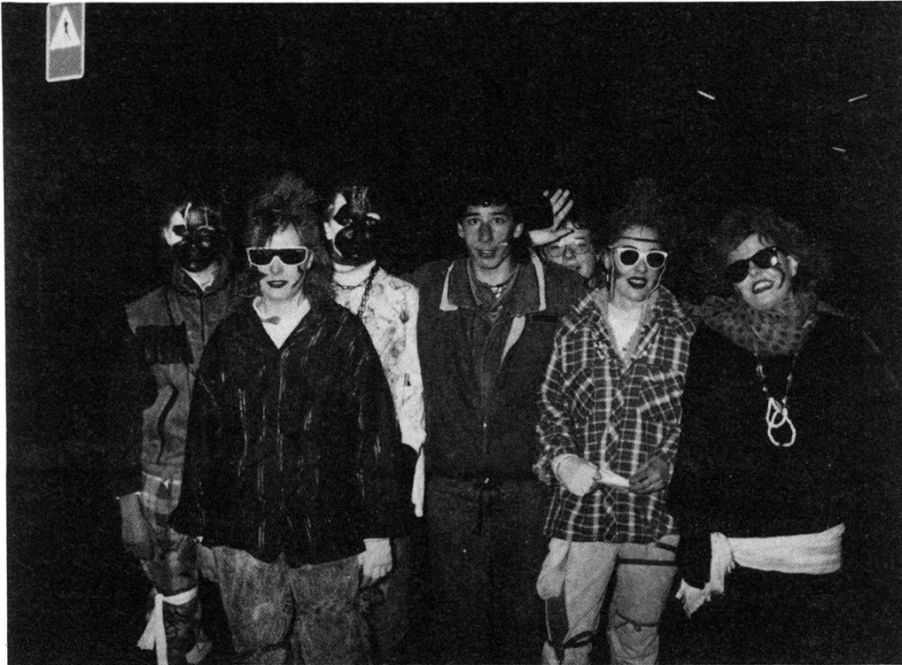
Fig. 2. Les «punks», modèles actuels de rébellion. «Chessleta» à Glis, le 10 février 1988.

de la diversité des catégories sociales qui composent une collectivité; enfin, toute identité connaît la nécessité de se reproduire en conciliant la permanence et le changement. Cette dynamique se traduit par des tensions inter- et intracommunautaires auxquelles la fonction symbolique offre un recours grâce à la recreation du réel qu'elle opère dans l'imaginaire. Mais pour qu'il y ait soulagement des tensions, c'est-à-dire efficacité symbolique, il faut que la collectivité fasse l'expérience concrète du réel remodelé par l'imaginaire. Une des fonctions du carnaval consiste précisément à donner à voir et à vivre le produit du travail symbolique, sous la forme d'une image d'elle-même et du monde que la collectivité met en scène à l'intention de ses membres. L'observation en profondeur d'un carnaval particulier permet de découvrir qu'il y a spécialisation des rôles dans la mise en scène de cette image et que les adolescents y contribuent de manière originale.