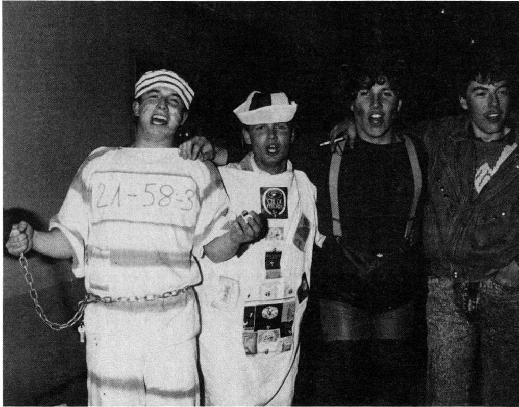
Fig. 3. Le bagnard et le marin, figures plus traditionnelles de l'évasion hors du carcan des règles quotidiennes. «Kasbafest» à Brigue, le 14 février 1988, jeudi gras.

carnaval depuis la fin des années soixante 7 . Chacun des trois lieux possède sa propre société carnavalesque qui comprend deux cents membres environ et rivalise avec les deux autres pour que «son» carnaval ait le plus d'éclat. Cet esprit de compétition explique la couleur emblématique très marquée de la fête actuelle. C'est ainsi que Brigue vit à carnaval sous le signe de l'Orient: le Türkenbund métamorphose chaque année la ville en casbah exotique baptisée Mekka et dominée par la silhouette d'un chameau, effigie gigantesque devenue l'emblème carnavalesque de Brigue. A Glis, le carnaval a pris pour thème la forêt; les membres de la Bäji-zumpft , transformés en sorcières, forment la suite du Bäjinool , mannequin géant représentant un montagnard qui rappelle l'origine paysanne des habitants. Enfin, dans la petite ville de Naters, c'est le dragon d'une légende de l'endroit que la société des Drachentöter fait vivre à carnaval; entouré du prince Jozzelin et de ses barons, l'animal emblématique prend part à toutes les festivités. La connaissance de l'histoire locale révèle le sens de cette emblématisation carnavalesque 8 .