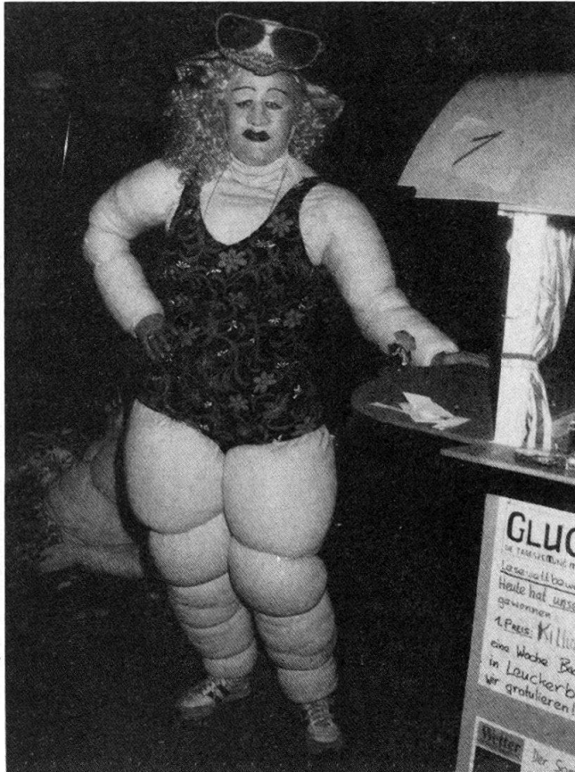
Fig. 6. L'obésité carnavalesque ou le triomphe ultime de la vie. Bal «turc» à Brigue, le 6 février 1988

les pétarades des vélomoteurs se mêlent aux grincements des crécelles et aux notes métalliques de vieilles casseroles battues de leur couvercle.