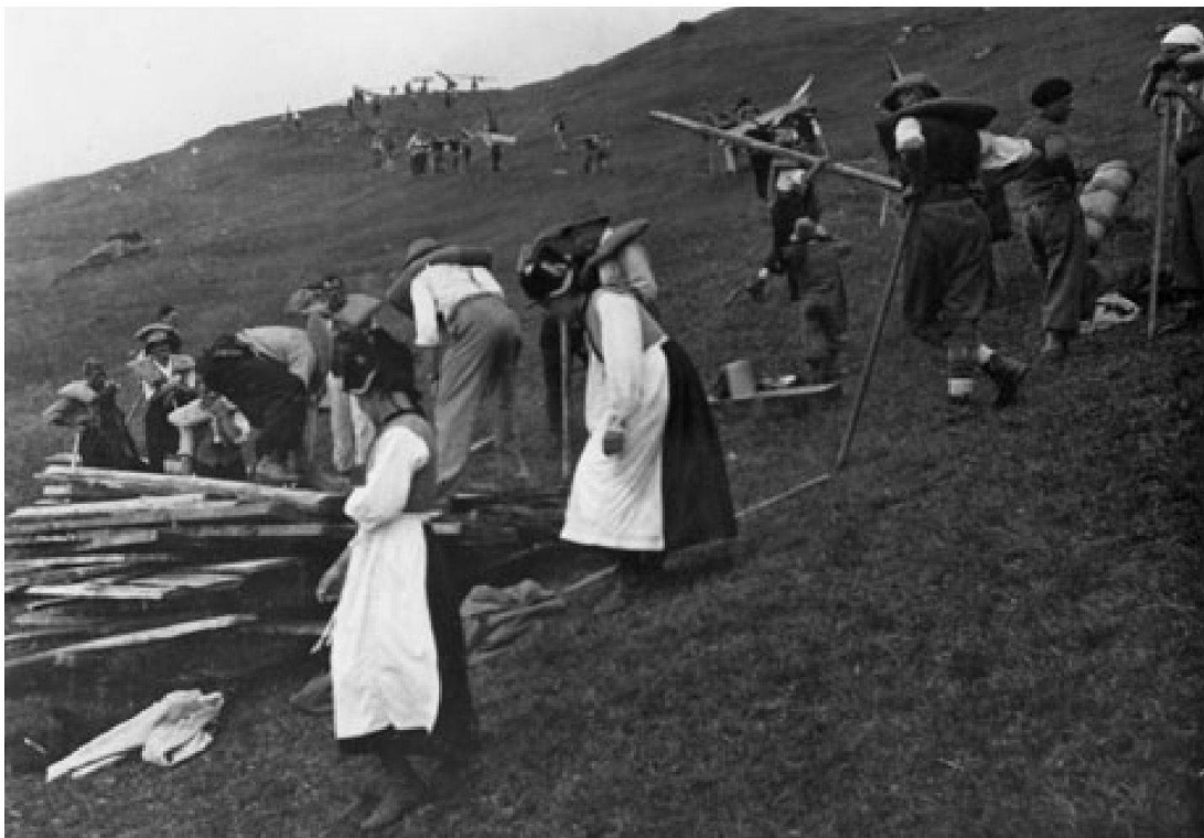
Abb. 1: Holztragen auf die Lauchernalp, 1936.

In den deskriptiven Talmonographien der älteren Volkskunde, insbesondere bei Friedrich Gottlieb Stebler (1842–1935) und Hedwig Anneler (1888–1969), wurde mit dem zeittypischen «ethnographischen» Blick der Elitekultur bürgerlicher Gesellschaften um die Jahrhundertwende die Gegenwelt des alpinen Lötschentals betrachtet. 5 Dabei wurde eine alpine Kultur suggeriert, bei der alle Bergbauern derselben landwirtschaftlichen Arbeit mit demselben Aufwand und derselben Mühe nachgingen. Zusätzlich erzeugten die ausführlichen Darstellungen der genossenschaftlichen Arbeitsorganisationen wie das Gemeindewerk, das Alpenwerk und das Holztragen (allesamt Formen des Gemeinwerkes im Sinne Arnold Niederers) nahezu sozialistisch anmutende Gesellschaftsbilder (vgl. Abb.1.).