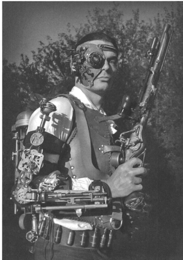
Abb. 2: Steampunker in Borg-Optik. Foto: Alexander Schlesier, Wikimedia-Commons: https://commons.wikimedia.org/wiki/File:Steampunk_outfit_mask.jpg .