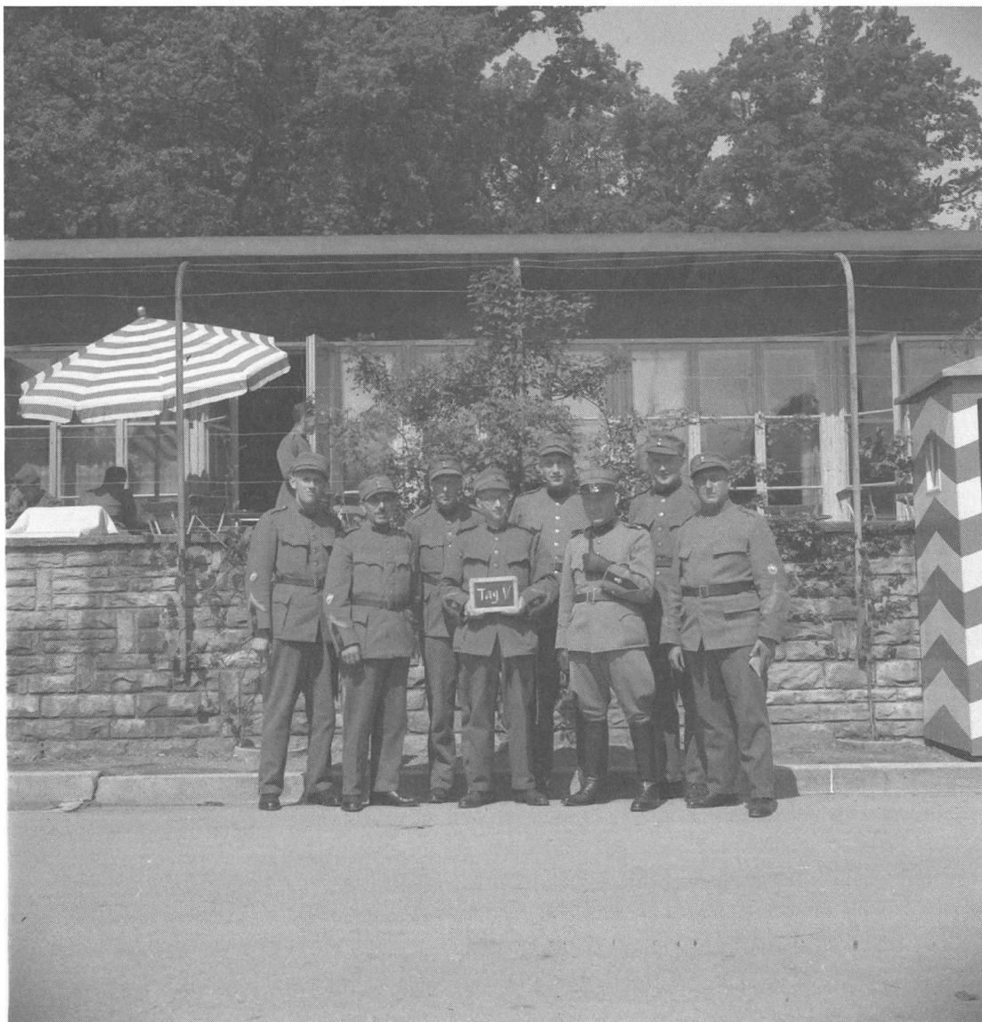
Abb. 12: Gruppenbild der Fliegerabwehrbatterie 311 mit der Tafel «Tag V».

Kraftwerk mit Soldaten, die als Angehörige der Fliegerabwehrbatterie 311 identifizierbar sind. Besonders hervorzuheben ist ein Gruppenbild mit acht Soldaten (Abb. 12). Sie stehen vor einem Gebäude mit Terrasse und gestreiftem Sonnenschirm, auf der Terrasse sitzen weitere Soldaten. Der Soldat in der Mitte hält eine kleine Tafel mit der Aufschrift «Tag V». Die Batterie umfasste rund 120 Männer, möglicherweise bilden diese acht das engere Umfeld von Ernst Brunner. Der fünfte Tag in Rekingen war der Dienstag, 1. Mai 1945. Im Tagebuch hält Leutnant Peyer unter «Besonderes» fest: «Befehl fürstellungsabbruch ab morgen 0700 trifft ein. Radiomeldung 2200: Der Führer Adolf Hitler gefallen. Die Franzosen haben einen Nationalsozialisten über dem Rhein erschossen.» 47 «Tag V» könnte also auf ein besonderes Ereignis hinweisen. Allerdings bleibt unklar, ob tatsächlich der fünfte