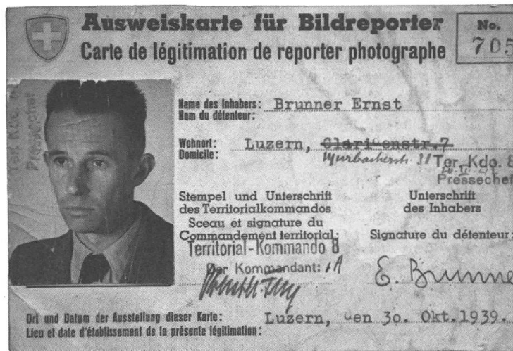
Abb. 2: Ausweiskarte für Bildreporter von Ernst Brunner. Foto: Ernst Brunner (Ausschnitt), SGV_12N_03401 © Schweizerische Gesellschaft für Volkskunde.