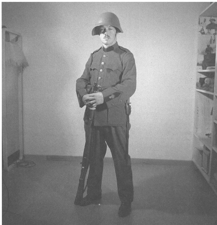
Abb. 7: Porträt eines stehenden Soldaten mit Gewehr in der Wohnung von Ernst Brunner.