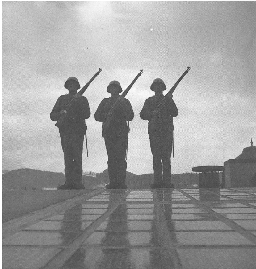
Abb. 4: Soldaten beim inszenierten Wachestehen auf dem Dach der Hauptpost Luzern. SGV_12N_05335