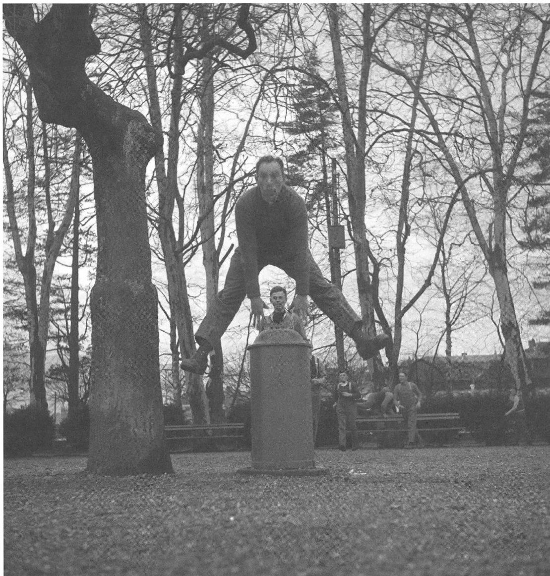
Abb. 1: Soldaten der Fliegerabwehrbatterie 311 springen über einen Abfalleimer. Foto: Ernst Brunner, SGV_12N_05439 © Schweizerische Gesellschaft für Volkskunde.

von Waffen, Stellungen, Unterkünften, Flüchtlingen und der Kriegswirtschaft passen nicht ins Bild der bäuerlichen Schweiz, welches Brunner sonst oft herstellte. Zwar behandelte Pfrunder 1995 Themen rund um den Zweiten Weltkrieg, setzte den Schwerpunkt aber auf die ländlichen, «verschwindenden» Welten. Die wenigen darauf folgenden Publikationen über Brunner fokussierten andere Aspekte, etwa seine Nähe zur dokumentarischen Fotografie der Farm Security Administration in den USA oder seine künstlerische Bildsprache, stützten sich in ihrer Argumentation aber wiederum auf Fotografien, die das Bild einer bäuerlichen, ländlichen Schweiz zeichnen. 4 Daraus leitet sich die Frage ab, inwiefern explizit eine «bäuerli-