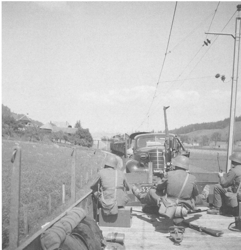
Abb. 8: Soldaten der Fliegerabwehrbatterie 311 auf einem offenen Zugwagen. Foto: Ernst Brunner, SGV_12N_20217 © Schweizerische Gesellschaft für Volkskunde.

Wenn das taktische Können unserer Leute dem guten Willen ebenbürtig wäre, liesse sich aus unserer Mannschaft eine Elitetruppe bilden. Besser so! Das Können kann noch bereichert, erweitert werden. Würde es am guten Willen fehlen, wäre alle Hoffnung verloren.» 44 Nicht nur der Umfang des Eintrages, auch die Art und Weise, wie Brunner schreibt, unterscheidet sich von der «offiziellen» Version. Er reflektiert das «taktische Können» und unterstreicht gleichzeitig den Willen seiner Einheit. Zudem skizziert Brunner die Felddienstübung in Bussy: Rund um die Kirche stehen Soldaten, die vermeintlich aufeinander schiessen, und ein Flugzeug fliegt über das Dorf (Abb. 10). Da bei allen Militärbildern wenige bis keine Kontextinformationen von Ernst Brunner festgehalten wurden, ist bei einem Grossteil unklar, an welchem Ort und in welchem Zeitraum die Aufnahmen entstanden sind. Ergänzende Quellen wie die Tagebücher der Fliegerabwehrbatterie 311 helfen einerseits, die Fotografien zu kontextualisieren, sind aber andererseits auch Mittel der nachträglichen Bedeutungszuschreibung. Die beiden Tagebücher bilden neben den Fotografien eine Grundlage für die Analyse der Militärdienstzeit Brunners, insbesondere vom Sommer 1944. Zusammen erlauben sie Einblicke ins Alltagsleben der Soldaten wie auch in das Bild, welches Brunner vom Aktivdienst geben wollte. Für Bildbetrachter/-innen werden zudem Abläufe, Tätigkeiten und Banalitäten aus