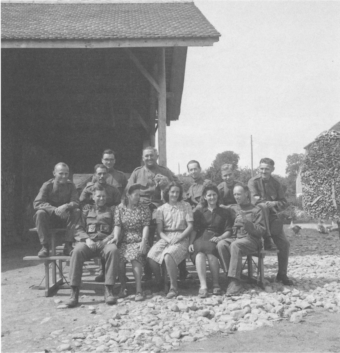
Abb. 11: Gruppenbild der Fliegerabwehrbatterie 311 mit Einwohnerinnen von Morens. Foto: Ernst Brunner, SGV_12N_20263 © Schweizerische Gesellschaft für Volkskunde.

Die Gründe für seine veränderte fotografische Praxis sind nicht rekonstruierbar. Bei militärischen Aufnahmen muss, wie gezeigt, davon ausgegangen werden, dass stets mehrere Faktoren mitspielten.