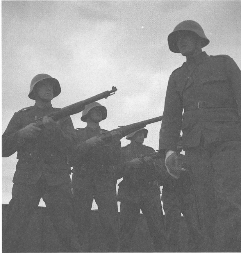
Abb. 3: Posierende Soldaten mit dem Gewehr im Anschlag.