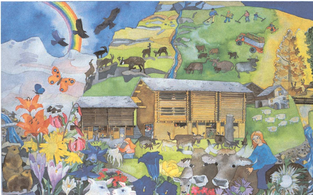
Abb. 1: Eine mögliche Vision eines guten, sicheren und schönen Lebens in den Alpen: Wölfe sind nicht darin enthalten. Illustration einer wolfskritischen Informationsveranstaltung. Verein Lebensraum Schweiz ohne Grossraubtiere: Themenabend Wolf und Herdenschutz, www.lr-grt.ch/de-de/54-themenabend-wolf-und-herdenschutz , 10. 3. 2020.

Bevölkerung durchsetzen zu wollen. Dabei äussert er unter anderem auch die Vermutung, städtische Menschen würden damit ihr schlechtes ökologisches Gewissen reinwaschen wollen. Neben Naturparks wie dem «Parc Adula»-Projekt werden auch Grossraubtiere und insbesondere Wölfe als Waffen dargestellt, mit denen die Bergbevölkerung an ihrem gewohnten Lebensstil gehindert und so Schritt für Schritt aus den Alpentälern verdrängt werden soll. Wölfe werden damit zu Mitteln der Durchsetzung politischer Bevormundung: «PRO NATURA wollte sich (wörtlich) zum hundertsten Geburtstag einen Nationalpark schenken» und es wurde für einen «geordneten Rückzug des Menschen aus bestimmten Alpentälern» plädiert. Das blieb ein intellektuelles Wunschdenken dieser Verbände. Durch unsere basisdemokratischen Grundrechte und das zentrale Mitspracherecht der betroffenen Gemeinden, wurde dies abgelehnt oder die Planung mangels Zuspruch abgebrochen. Das anvisierte Ziel wurde nicht erreicht, weil die betroffene Bevölkerung den Absichten der Naturschutzorganisationen misstraute. [...] Aber als besondere Waffe, haben sie den in Umsetzung begriffenen Aktionsplan zur Wiederansiedlung des Wolfes im Köcher, der nun einen ungeordneten Rückzug aus bestimmten Alpentälern erzwingen soll, um so zu mehr Wildnisgebieten zu kommen.» 17