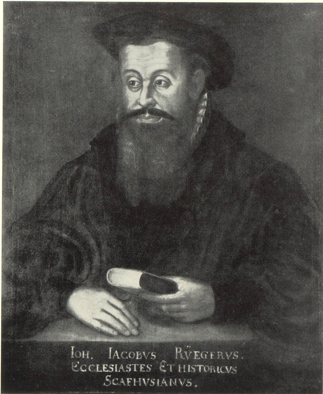
J. J. Rüeger, Oelbild um 1606, Künstler unbekannt. Im Museum zu Allerheiligen Schaffhausen.