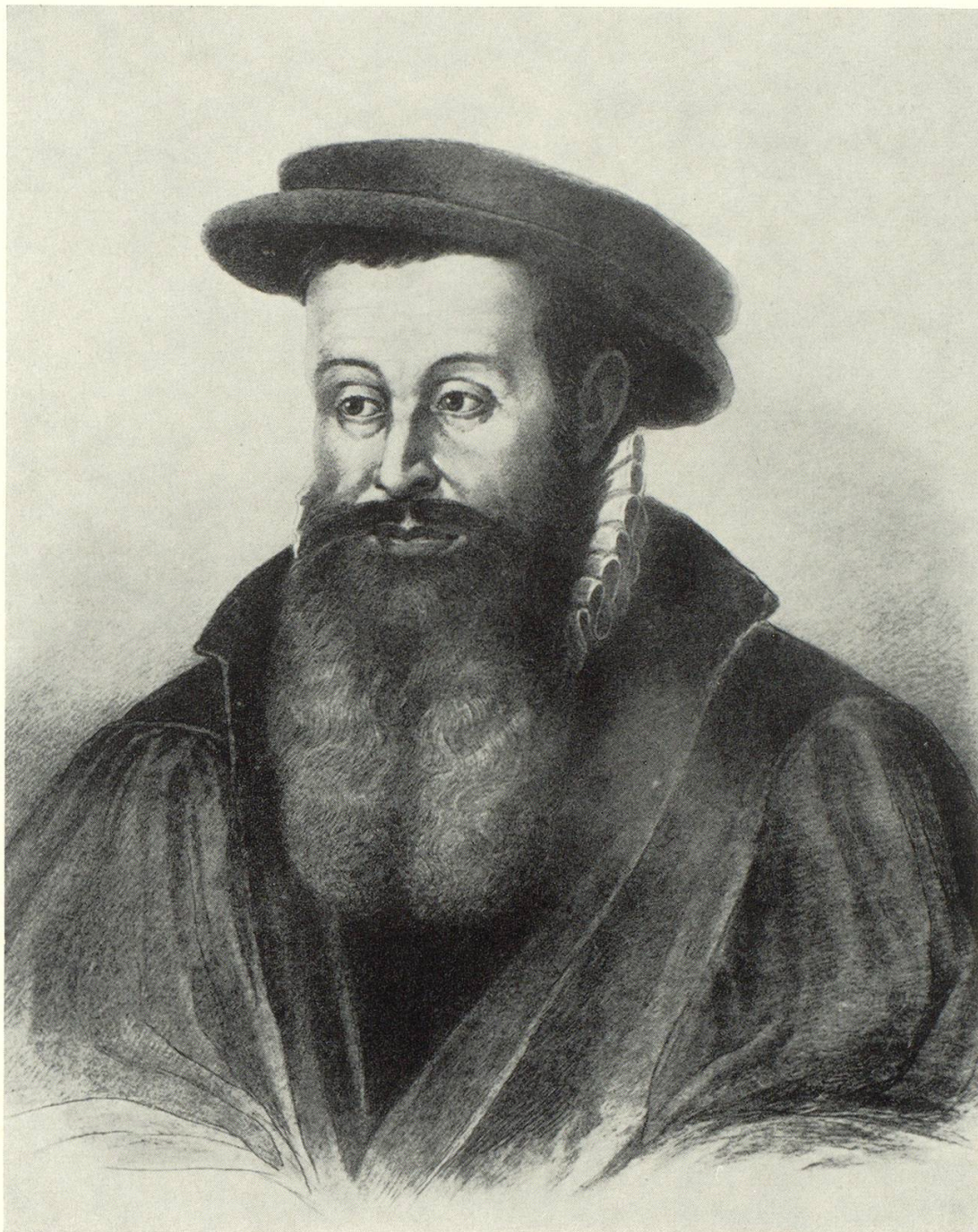
J. J. Rüeger, Zeichnung von Friedrich Weber, 1879. Lithographische Beilage zum ersten Band der Rüeger-Chronik, 1884.