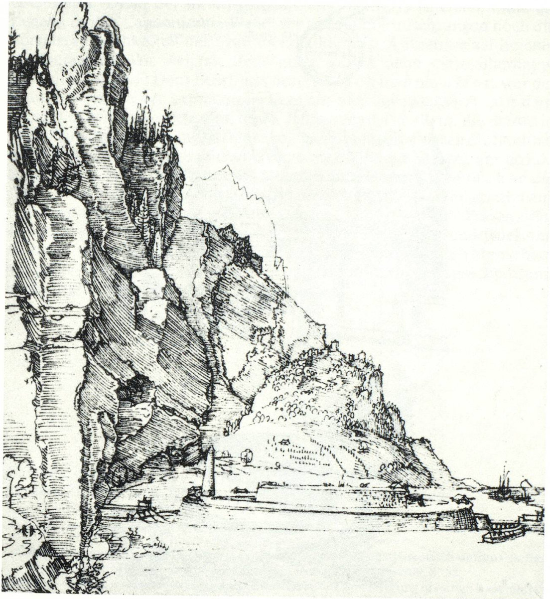
Abb. 1 Die Zirkularfestung in der Landschaft, 1527. Federzeichnung von Dürer.