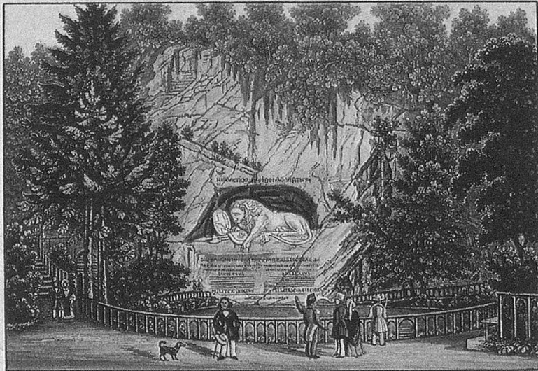
Vue du Monument à Luzerne érigé à la mémoire des Suisses du 10. Août 1792. Zurich, chez R. Birkmann peintre - Rindermarkt N° 25 A.

im Luzerner Chordu der neuen Orgel nach dem Löchergerade gemacht, in der die Wirkstoffe bei jeder Amon eine kleine Verschiebung gemacht sein haben besetzt. Die Amon, meistens 1/2 Meter, welche eine große Menge fassen. können aber auf kein Merkmal. man besuche die das Lied und den Gesang.