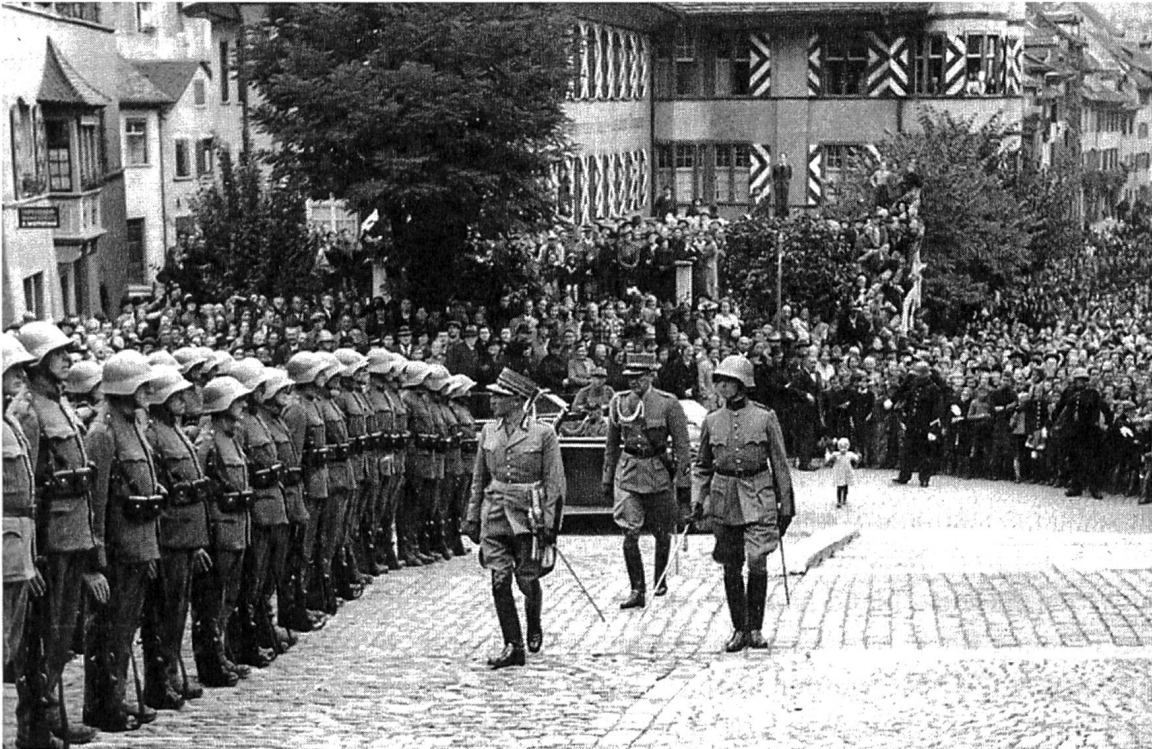
Am 4. Oktober 1939 machte General Guisan seinen Antrittsbesuch bei der Schaffhauser Regierung und wurde von der Bevölkerung, die ihn tief verehrte, begeistert empfangen. (PB M. Wipf)

rungrmassen zu evakuieren und an andern Orten unterzubringen». Grundsätzlich wolle man sich deshalb «auf die dringend notwendigen Fälle beschränken». Als solche galten, in abnehmender Priorität: 1) alle Ortschaften in der eigenen Abwehrfront; 2) Ortschaften, die dem Feind als Angriffsstellungen dienen könnten; 3) Ortschaften unmittelbar hinter der Abwehrfront, die dem feindlichen Feuer besonders ausgesetzt wären. 39 Es wurde auch darüber debattiert, ob die einzelnen Territorialkommandos, welche für die Evakuationsvorbereitungen verantwortlich zeichneten, ermächtigt werden sollten, öffentlich darüber zu informieren. Oberstkorpskommandant Rudolf Miescher etwa versprach sich eine allgemeine Beruhigung, «wenn die Bevölkerung sieht, dass sich die militärischen Kommandostellen mit der Organisation der Evakuation befassen». Ansonsten riskiere man, «dass die Bevölkerung sich selbst bewaffnet und auf den Kleinkrieg rüstet». 40 Die eigentlichen Evakuationsbefehle sollten allerdings, wie bereits erwähnt, «erst unmittelbar vor der Evakuation» den