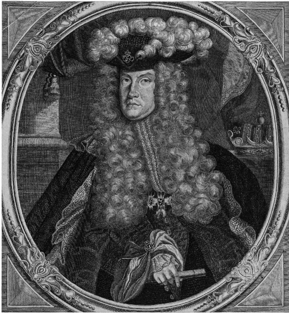
Kaiser Karl VI. (1685–1740, Regierungszeit ab 1711), höchste Instanz im Heiligen Römischen Reich deutscher Nation.