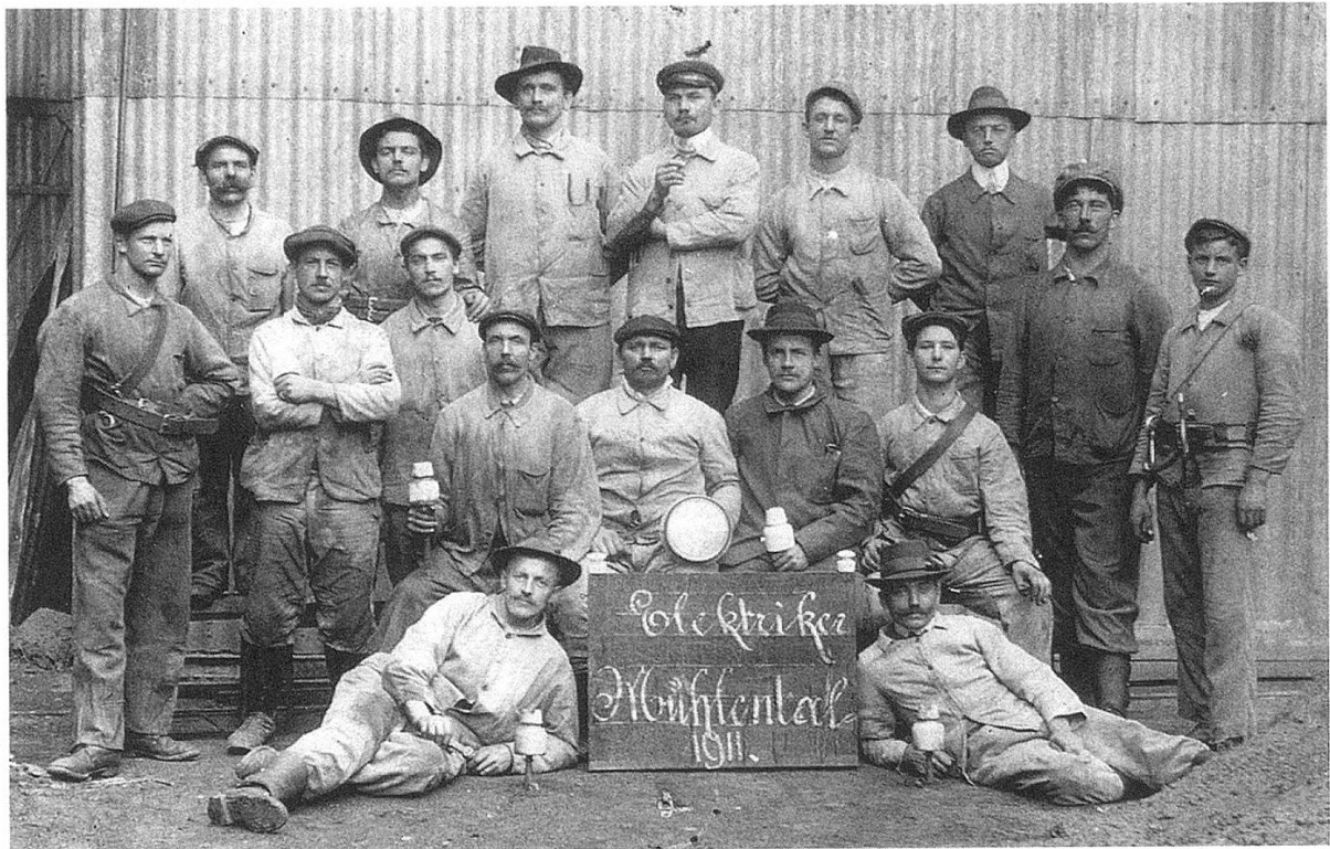
Elektriker wurde im Zuge der Elektrifizierung um die Jahrhundertwende zum «Modeberuf».