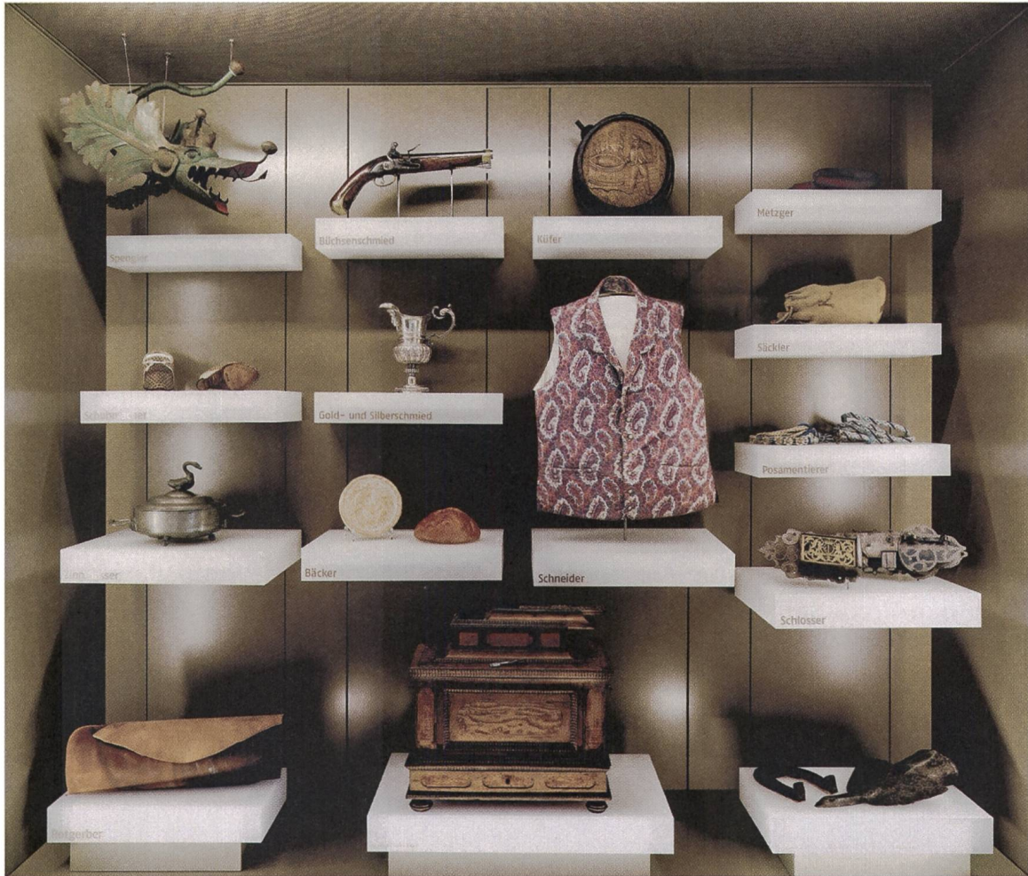
Abb. 4: Themenraum «Handwerk und Gewerbe». Vitrine mit Handwerksprodukten. (Museum zu Allerheiligen Schaffhausen, Foto Jürg Fausch)

Darstellung wiedergegeben wird, zeigt die grosse Vielfalt an Handwerksberufen. In der Stadt, die damals rund 7000 Einwohner zählte, arbeiteten 751 Handwerksmeister. Sie verteilten sich auf 42 Berufsinnungen. Das Spektrum reichte von der grössten Innung der Schuhmacher (76) über die mittelgrosse der Schreiner (32) bis zur kleinsten der Nadelmacher (3).