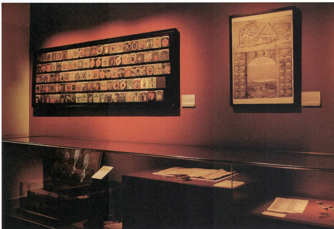
Abb. 1 : Themenraum «Macht und Politik». Objekte der Schaffhauser Zünfte. An der Wand «Rucktafel» der Zunft zum Metzgern 1663/1829 (links) und Schaffhauser Stadt- und Regierungskalender von 1723. In der Vitrine Lade der Gesellschaft zum Herren (links) und Zunftbrief der Schmiede von 1535 (Mitte). (Museum zu Allerheiligen Schaffhausen, Foto Ariane Dannacher)

verfassung wird dem Besucher anhand einer prominent platzierten grafischen Darstellung verständlich gemacht.