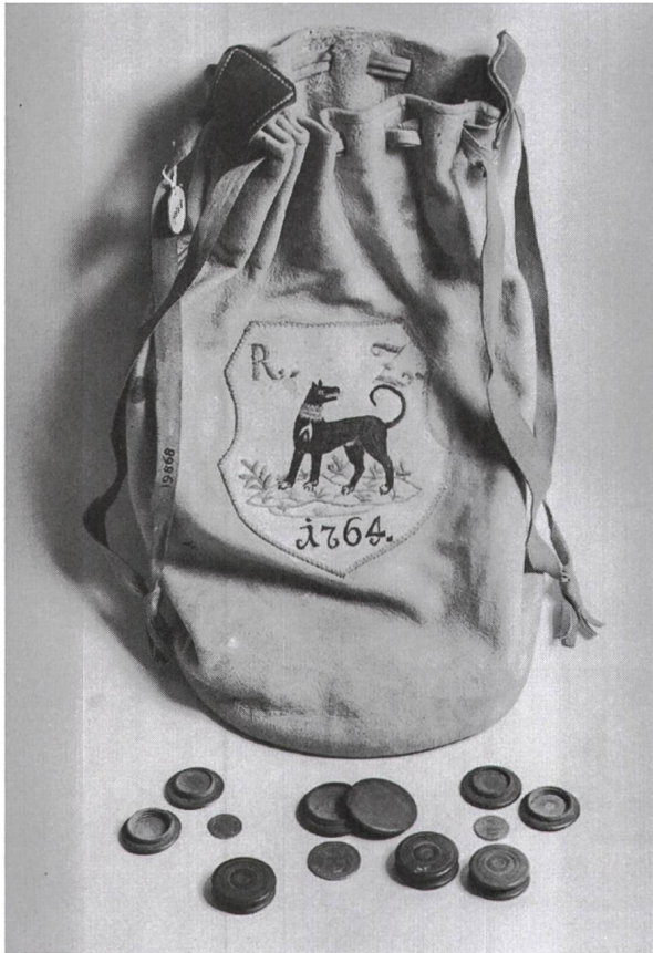
Abb. 3: Wahlgeldbeutel der Zunft zum Rücken von 1764 mit Zunftemblem. (Museum zu Allerheiligen Schaffhausen)

Um jederzeit die Gewissheit zu haben, wer von den Zunftgenossen überhaupt berechtigt war, an der Ämterverlosung oder der Wahl in den Vorstand teilzunehmen, wurden Wahlrodel gedruckt. Ein solches Verzeichnis der Zunft zum Schneidern aus dem Jahr 1759 ist neben den Wahlgeldbeuteln ausgestellt. 12