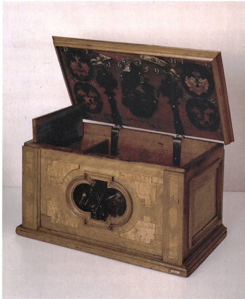
Abb. 5: Lade der Handwerksinnung der Chirurgen und Barbiere von 1659. (Museum zu Allerhei- ligen Schaffhausen)

Wie die Zünfte verfügten auch die Innungen über eigene Laden, worin sie ihre Dokumente wie Handwerksordnungen und Protokolle aufbewahrten. Von den zahlreichen Innungsladen im Museumsbestand werden zwei besonders schöne Exemplare in einer Vitrine präsentiert. Die Lade der Chirurgen und Barbieri von 1659 zeigt an der Front das Emblem des Berufsstandes und an der Innenseite des Deckels vier gemalte Wappen und reich gravierte Beschläge für Schloss und Scharniere (Abb. 5). 18 Mit einer besonders kunstvoll gearbeiteten Lade stellten die Schaffhauser Schreiner die Fähigkeiten ihres Berufsstandes zur Schau. Der Deckelaufsatz der prächtig geschnitzten Nussbaumlade wird durch eine Vanitas-Darstellung in der Form eines nackten Kindes, dessen Haupt auf einem Totenschädel ruht, bekrönt. Die vier abgeschragten Ecken zieren Allegorien der vier Jahreszeiten. Die Kartuschen an der Vorder- und der Rückseite zeigen das Innungsemblem und die Jahrzahl 1698, umgeben von fein geschnitzten Blattwerkkranken. 19