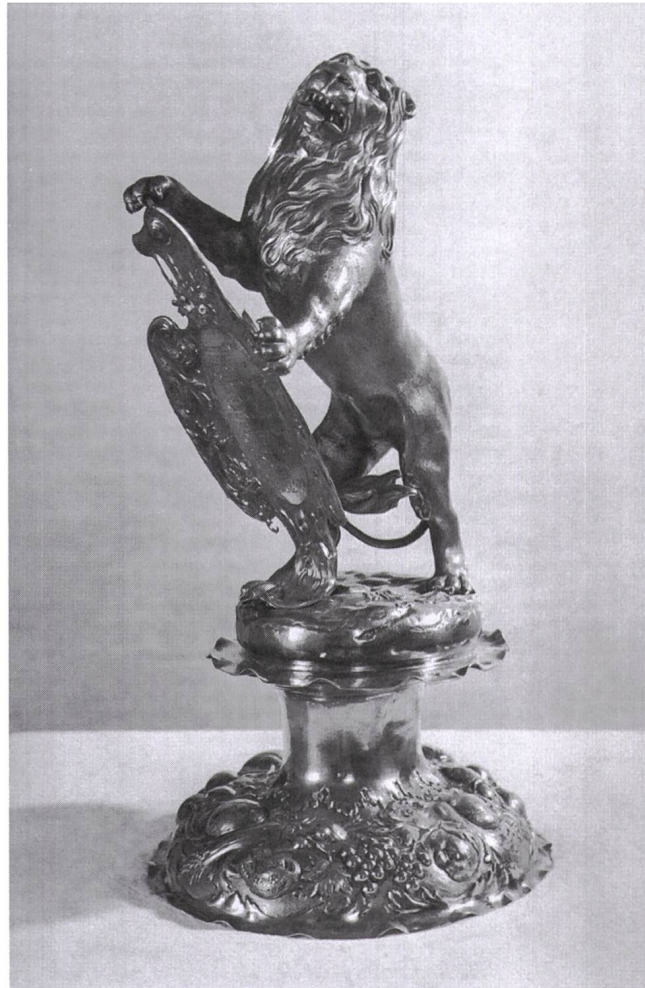
Abb. 8: Vergoldeter Löwenpokal der Schneiderzunft von 1683, Augsburger Arbeit. (Museum zu Allerheiligen Schaffhausen)

dabei nicht alle Aspekte beleuchten kann, liegt auf der Hand. Wenn der Besuch der Ausstellung beim Publikum zu Erkenntnisgewinn führt und Vergnügen bereitet, so ist das Ziel der Ausstellungsmacher erreicht.