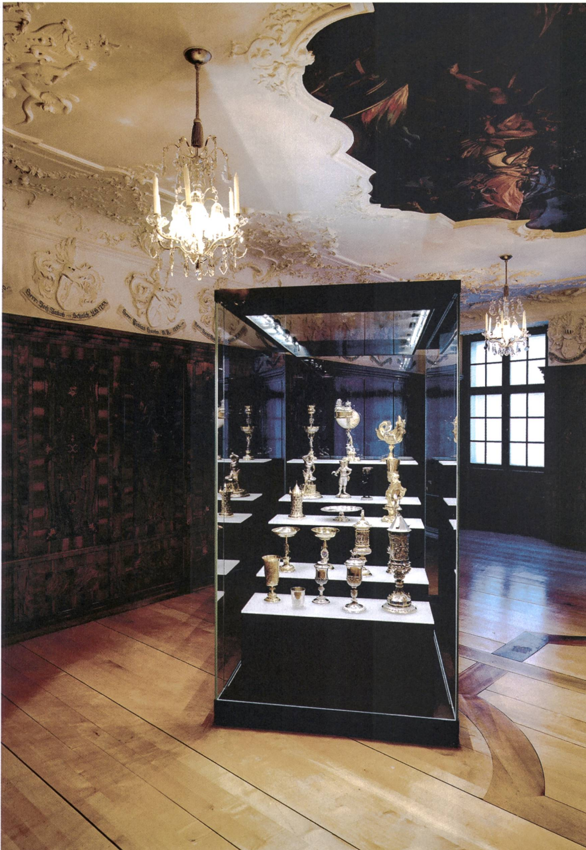
Abb. 7: Themenraum «Das Zunfthaus als gesellschaftlicher Mittelpunkt». Vitrine mit Zunfpokalen im Zunftsaal aus der Gerberstube. (Museum zu Allerheiligen Schaffhausen)