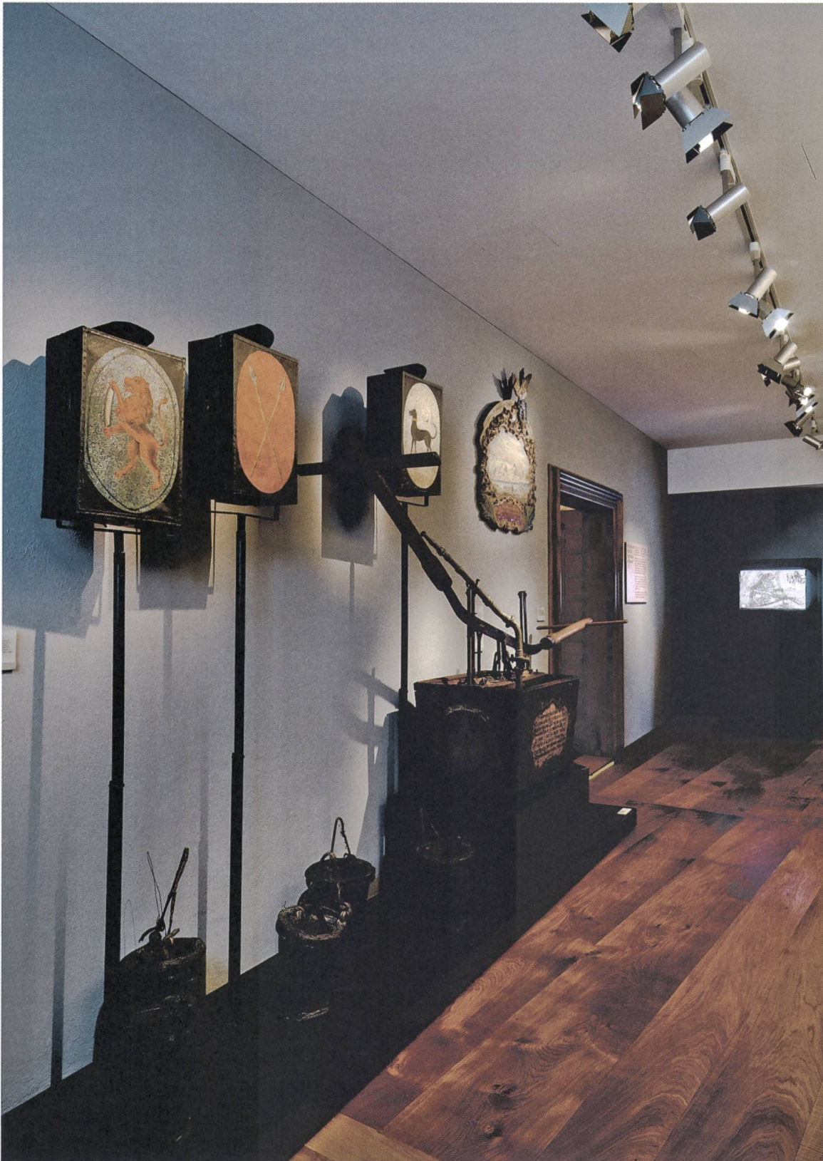
Abb. 6: Themenraum «Das Zunfthaus als gesellschaftlicher Mittelpunkt». Ausstellungssituation im Gang vor dem Zunfisaal der Gerber. Objekte des Feuerlöschwesens (Vordergrund) und interaktive Computerstation zu den Zunfthäusern (Hintergrund).