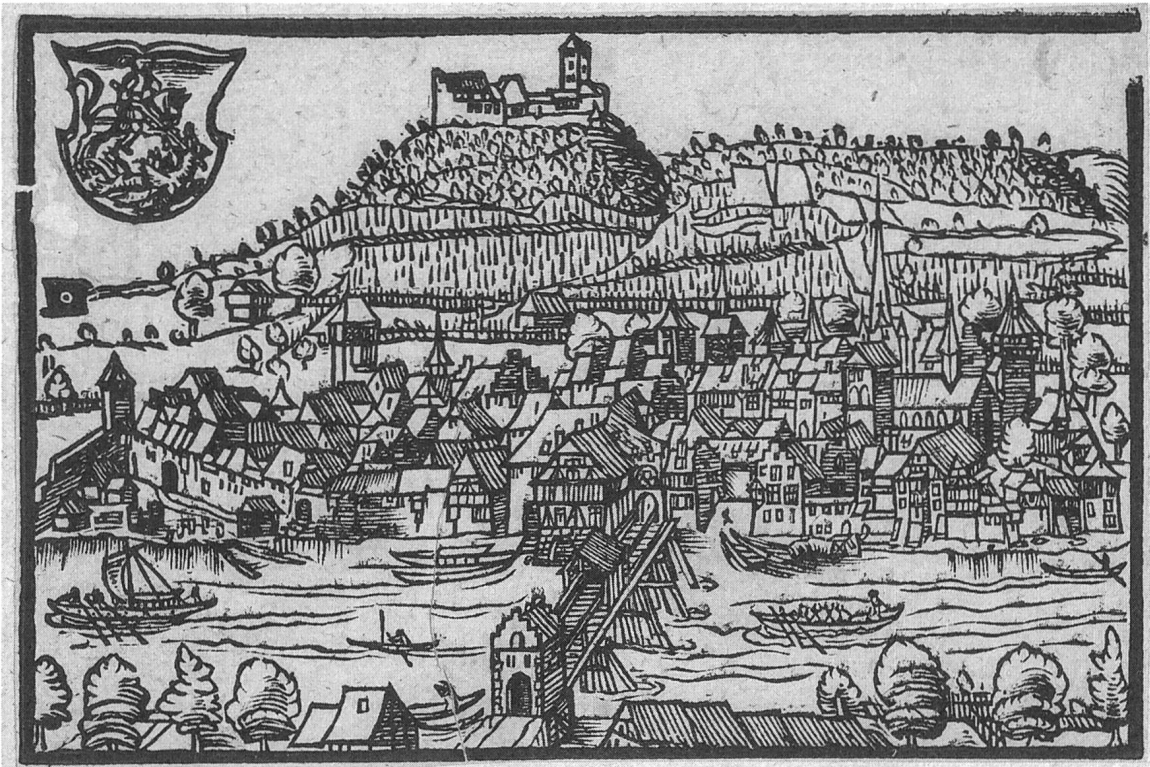
Abb. 4: Älteste bekannte Darstellung von Stein am Rhein, mit Gredhaus links und Salzhaus rechts der Brücke. (Stumpf'sche Chronik, 1548, Zentralbibliothek Zürich, Grafische Sammlung und Fotoarchiv)

Anbaugeländen über die doch ausgedehnte Ebene unter grossen Kosten an den Rhein zu schaffen, seien sie frühzeitig begegnet, indem sie die Reben beschnitten und so weniger, dafür höherwertigen Wein produziert hätten. Ob es damit seine Richtigkeit hat, lässt sich kaum belegen. Immerhin: Der Elsässer galt als qualitativ wesentlich besser und gehaltvoller als unser einheimisches Schaffhauser Gewächs. 134