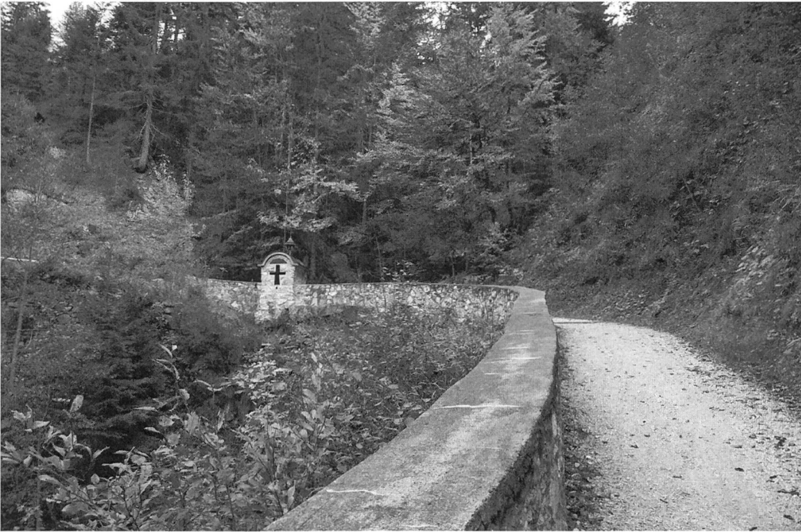
Abb. 2: Restaurierte Salzstrasse am Gaichtpass. (2007, Fotografie des Autors)

ableiten. Diese Menge reichte sogar, Nordbünden über Chur mit Salz zu versorgen. Bereits 1372 regelten die Churer mit den Feldkirchnern ihre Zollstreitigkeiten um Salz und Wein. 80 Nach dem Abzug der Salzmenge, welche für Vorarlberg um 1520 rund 200 Tonnen betragen haben mag, 81 blieben also noch 800 Tonnen für Nordbünden übrig.