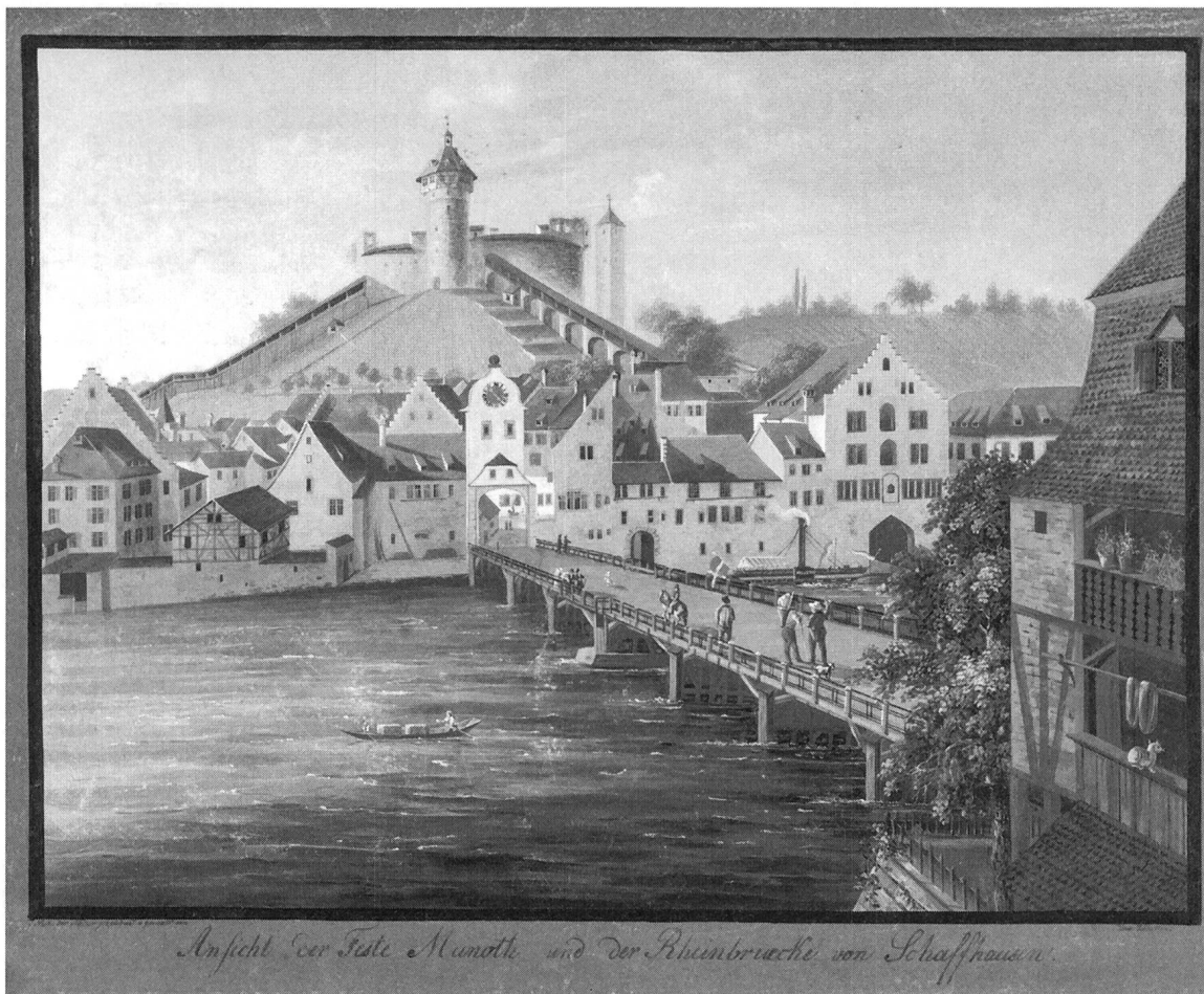
Abb. 5: 1835 sind die Gebäude des Schaffhauser Salzhafens noch alle vorhanden: Links von der Brücke das «Bindhaus», dahinter der Stufengiebel des «Scheibenhofes» (heute «Schweizerhof» genannt). Rechts vom Brückentorturm der mehrteilige Gebäudekomplex des «Salzhofes», an den das hohe «Paradieserhaus» (mit Stufengiebeln) anschliesst. Ganz rechts der «Neue Salzstadel», den man heute «Güterhof» nennt. (David Kölliker, datiert um 1835, Gouache, Museum zu Allerheiligen, Schaffhausen, Sig. B 9567)

«Kehrordnung» ist in Schaffhauser Dokumenten erst viel später die Rede, und dies im Zusammenhang mit Fahrten zu entfernteren Destinationen. 142