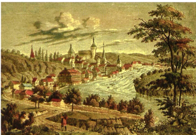
Auf dieser Ansicht von Westen sind die „Lächen“, welche die Weiterfahrt der Schiffe bereits vor dem Rheinfall verhierten, deutlich zu sehen (Johann Conrad Friedrich, um 1835)

Bis um 1840 – rund 700 Jahre lang – verschafften der schwungvolle Handel mit Salz und Getreide sowie der intensive Weinbau für die Rückfracht vielen Schaffhausern Arbeit und Brot. Als nach der Eröffnung von Schweizerhalle der Handel mit Salz aus den Ostalpen zusammenbrach, stürzte die Schaffhauser Wirtschaft in ihre tiefste Krise, aus der sie sich erst im Verlauf der Industrialisierung (siehe Rundgang 2) wieder lösen konnte.