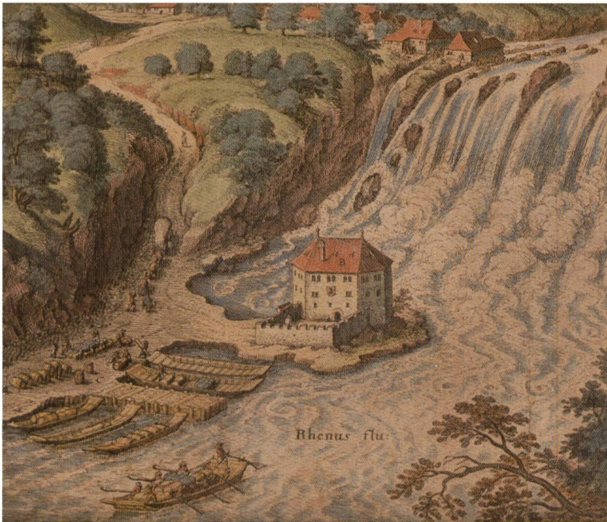
Salztransport auf der „Scheibengasse“ und Verlad im Hafen bei der Niederlage und Zollstelle „Schlössli Wörth“ (Merian)

folgt nun dem historischen Vorläufer, der auch heute noch „Scheibengasse“ heisst. Wörth war früher weniger ein Schloss als vielmehr ein gesichertes Lagerhaus, in dem wertvolle Fracht auch über Nacht eingelagert werden konnte. Eine lange Mole südlich des Gebäudes markiert heute noch den Hafen, wo Getreide und vor allem Salz für den Weitertransport nach Eglisau verschifft wurden.