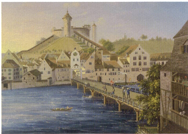
1835 sind die Gebäude des Schaffhauser Salzhafens noch alle vorhanden: Zwischen Schweizerhof und Güterhof befanden sich Wasserhof und Paradieserhaus (mit Stufengiebeln) (David Kölliker, um 1835)

Das letzte, östliche Viertel des „Freien Platzes“ wurde früher vom „Paradieserhaus“ eingenommen. Das überaus stattliche viergeschossige, den „Wasserhof“ um ein Stockwerk überragende Gebäude mit steilem Satteldach und Treppengiebel war ursprünglich das Wohnhaus der Familie Brümsi am Stad, die zu den ältesten Geschlechtern der Stadt gehörte. Die Familie hatte einst das Lehen der „Schiffledi“ vom Kloster Allerheiligen inne. 1318 schenkte sie das Gebäude dem Kloster „Paradies“. Das rheinaufwärts bei Schlatt gelegene Kloster der Clarissinnen liess das Gebäude zu einem Getreidespeicher umbauen, was ihm ein regelmässig fließendes Einkommen aus der „Niederlage“ (Lagergebühr für Transitwaren, hier für die Innerschweiz bestimmtes Getreide) einbrachte.