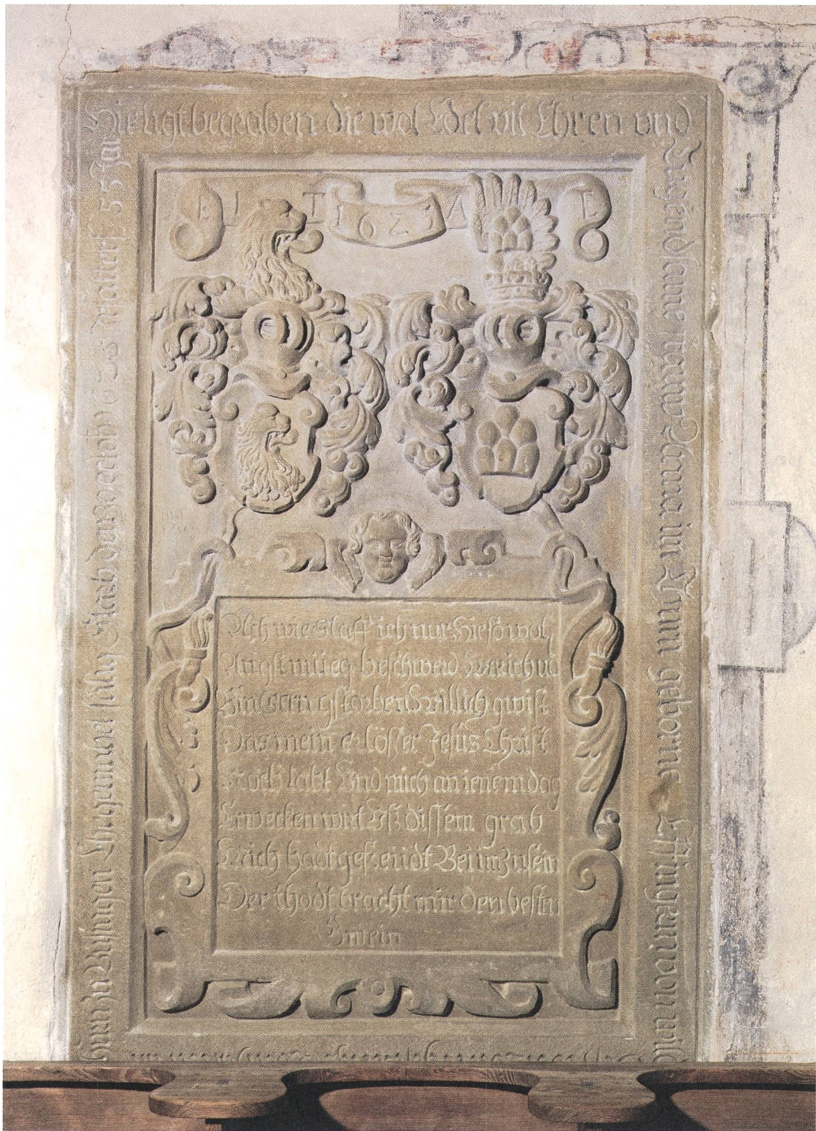
Abb. 1: Grabplatte/Epitaphium für Anna Im Thurn, geb. Effinger von Wildegg, 1625.