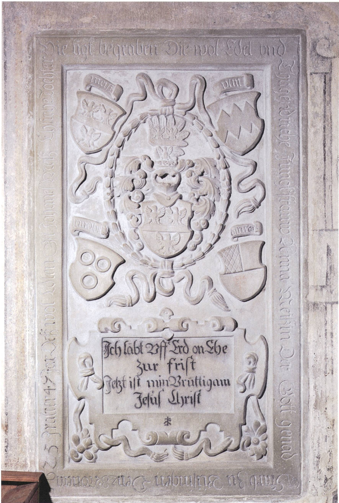
Abb. 3: Grabplatte/Epitaphium für Anna Meiss, 1625.